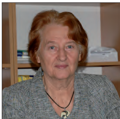
Світлана Єрмоленко доктор філол. наук, професор, член-кореспондент НАН України, зав. відділу Інституту української мови НАН України, м. Київ