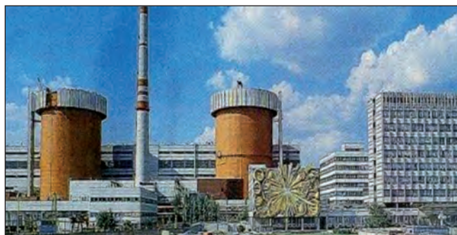
Південно-Українська АЕС — 3 енергоблоки