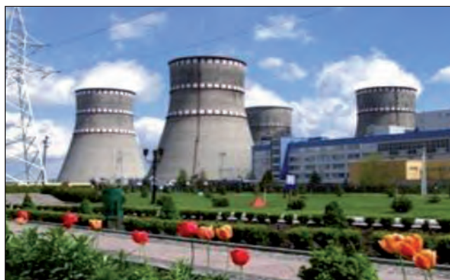
Рівненська АЕС — 6 енергоблоків