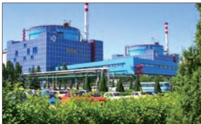
Хмельницька АЕС — 2 енергоблоки

Для ознайомлення з важливими елементами світової дорожньої карти розробки ядерних технологій 4-го покоління нами наведено рисунок, де схематично представлено графік розвитку ядерної енергетики в ХХ сторіччі. Зелена суцільна лінія показує внесок реакторів на теплових нейтронах, а блакитна штрихова — очікуваний внесок від реакторів 4-го покоління на швидких нейтронах. Як видно, потужність реакторів 4-го покоління в 2050 році має втричі переважати сумарні потужності реакторів на теплових нейтронах, які істотно мають зменшитися до 2070 року. Взявши до уваги, що середній термін експлуатації реактора на теплових нейтронах сягатиме близько 50 років і що протягом наступних 30 років будівництво реакторів на теплових нейтронах продовжуватиметься не меншими темпами, ніж тепер,