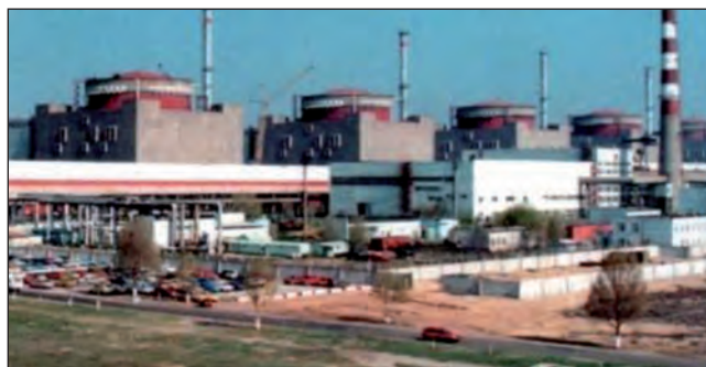
Запорізька АЕС — 6 енергоблоків