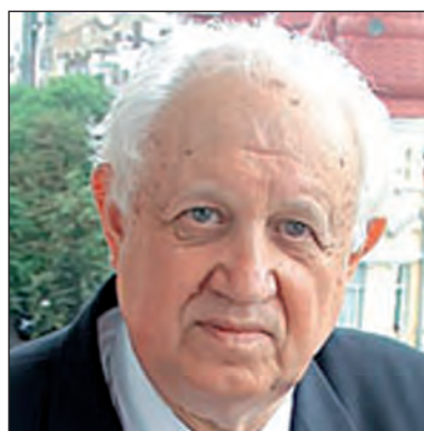
Віктор Бар'яхтар доктор фіз.-мат. наук, академік НАН України, почесний директор Інституту магнетизму НАН України і МОН України, м. Київ