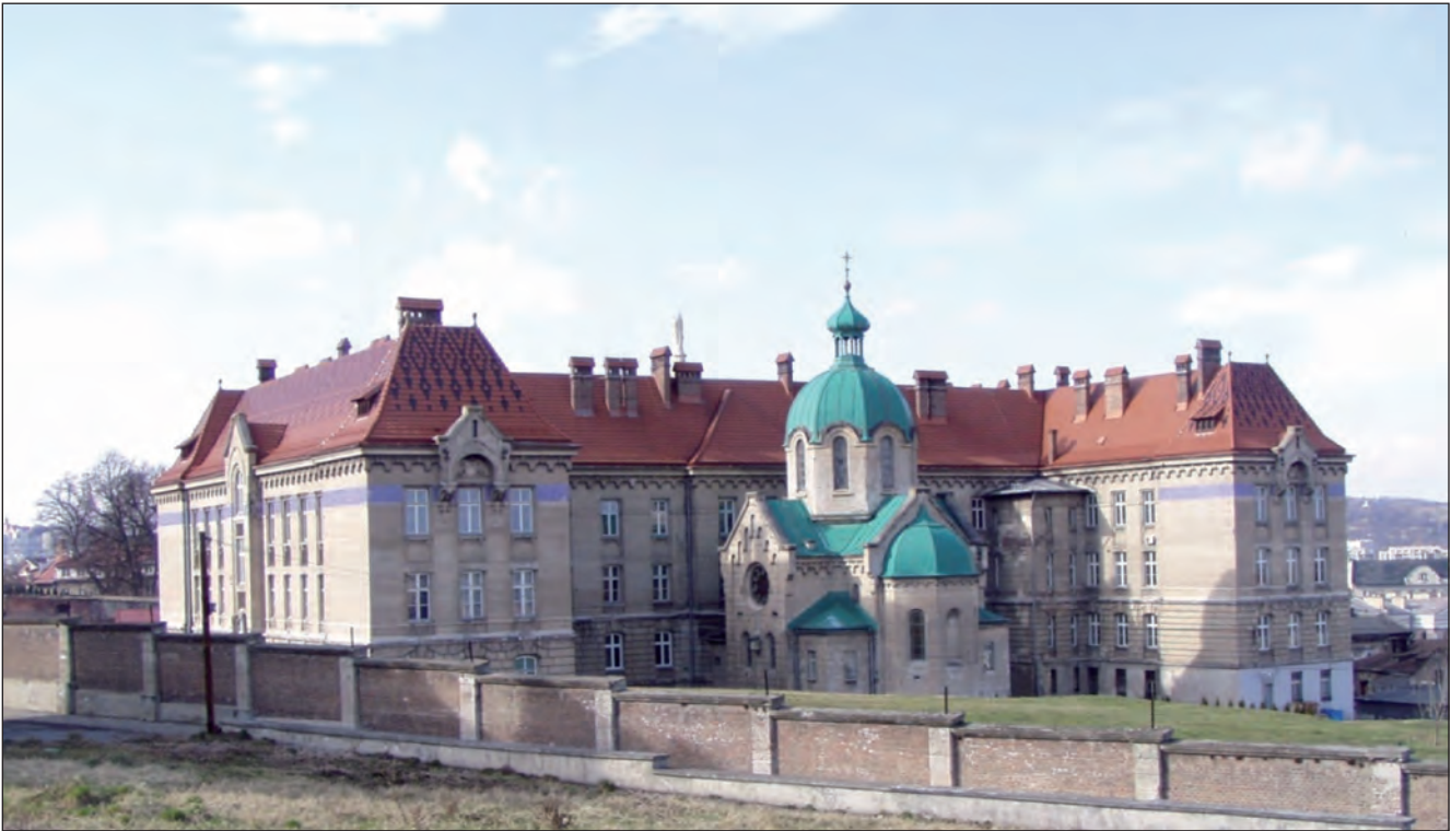
Греко-католицька семінарія, побудована у 1912 р.

повної душпастирської опіки. Тому панували безкарність воєнних інституцій, грабунки, терор, свідомі і несвідомі реквізиції дзвонів та нищення церков.