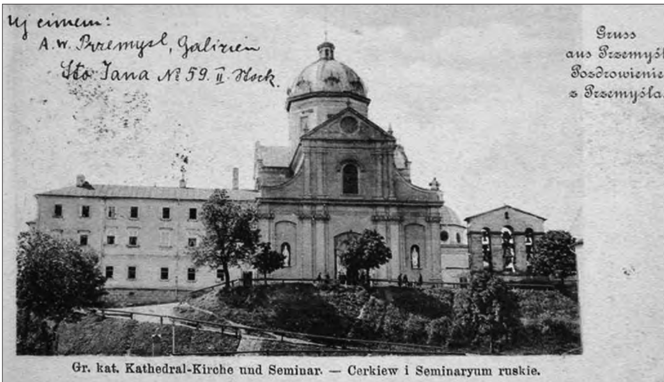
Греко-католицький собор у Перемишлі. 1880—1900 р.