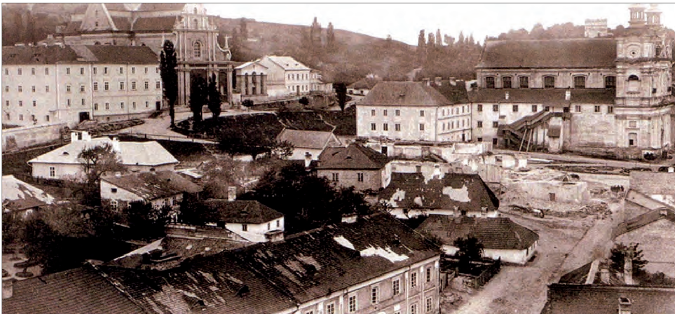
Фрагмент Старого міста у Перемишлі. Прибл. 1870—1880 роки. У центрі видно руїни, підготовлені під будову Палати греко-католицьких єпископів

Сприяв роботі жіночих чернечих громад Сестер Василянок та Сестер Службниць. Провів візитації більше половини парафій (перемиська єпархія нараховувала 712 парафій та 570 дочірних церков).