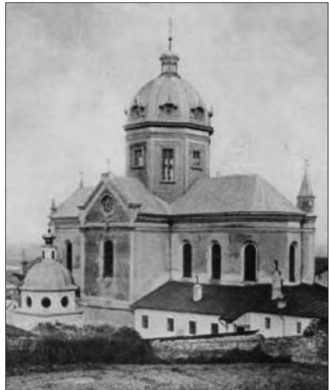
Греко-католицький собор у Перемишлі. Фото 1900—1915 рр.

Загалом у міжвоєнний період ніхто не заперечував законності власності й недоторканності історичної перемиської кафедри.