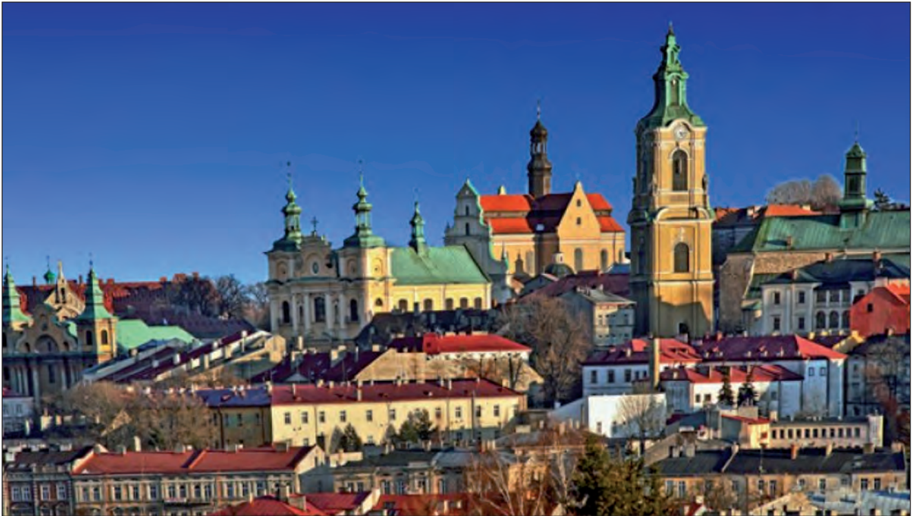
Місто Перемишль. Фото 2015 року.