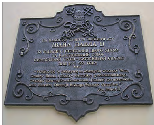
Пам'ятний знак про передачу костелу Пресвятого Ісусового Серця “греко-католикам на катедру і виключне користування”

Після підписання Конкордату польським урядом з Апостольською Столицею у 1993 р. та за схваленням Конституції III РП, УГКЦ у Польщі набула забезпеченості у всіх основних правах як повноправна Церква.