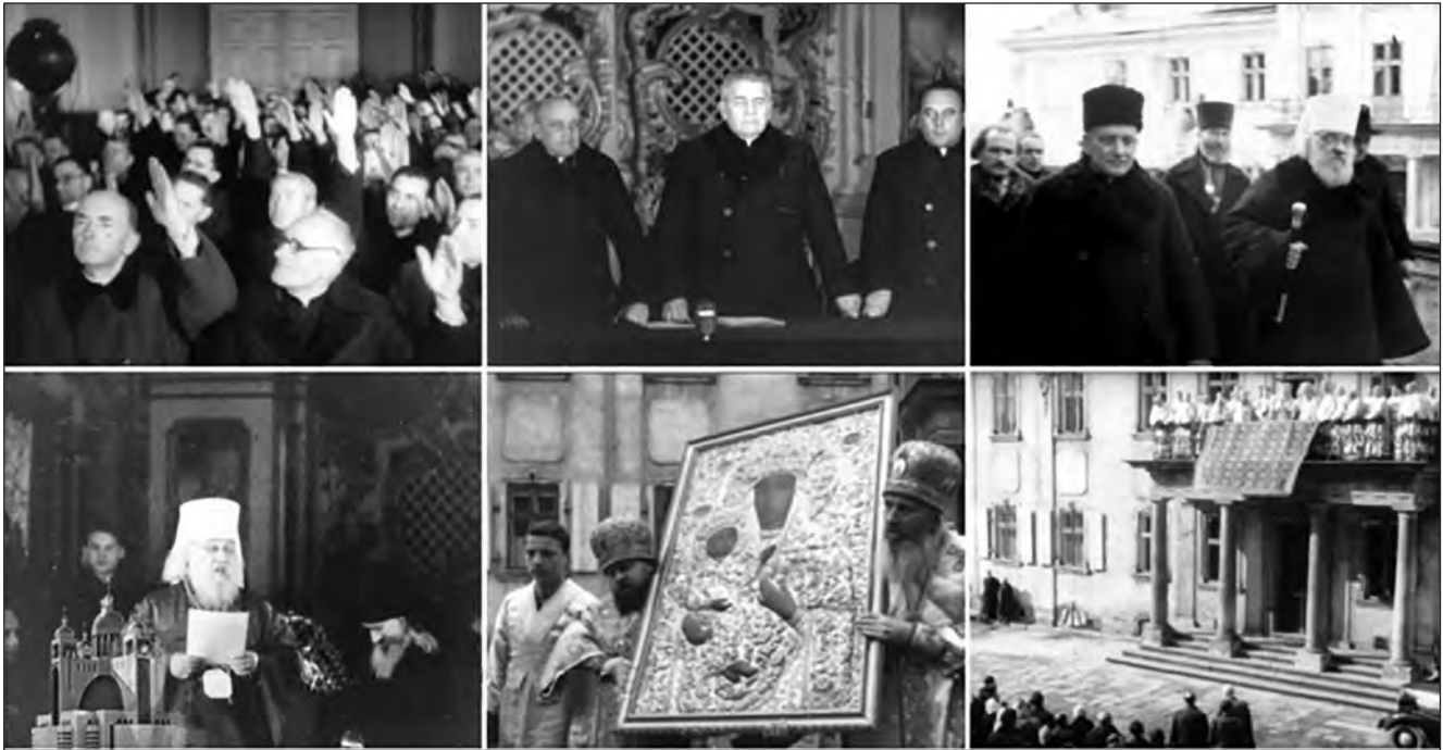
Псевдособор у Львові. 1946 р.