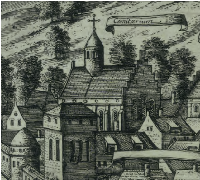
Кафедра на панорамі Перемишля 1617 р.

Хоча Перемиський єпископ Михайло Копистенський підписав заяву українських єпископів про приєднання до церковної унії у 1594—1595 роках, однак у 1596 р. відступив від неї ще перед її проголошенням у Берестю. Те саме вчинив і Львівський єпископ Гедеон Балабан .