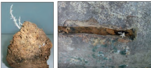
Див. також фотографії грибниць, виконані Марією Пасайлюк, у “Світогляді”, № 1, с. 13 (2017)

Учені навчилися вирощувати грибницю (міцелій) Герицію в лабораторії. Для цього поміщають шматочки плодового тіла гриба на поживне середовище, що нагадує холодець чи желе, але зварений із картоплі. При цьому дуже важливо знищити у картопляному желе і біля нього всю дисущу бактерію, тобто все простерилізувати. Для цього використовують бактерицидну лампу (УФ-лампу, кварцеву), яка випромінює ультрафіолетові промені і знищує бактерії. Також стерилізують інструменти, з якими працюють. Для цього використовують спирт та прожарюють приладдя у полум’ї спиртівки.