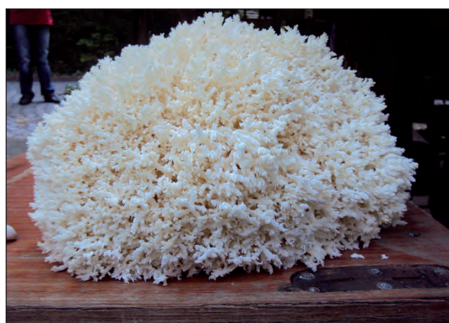
Геріцій коралоподібний ( Hericium coralloides )

І цей великий день настав! До лабораторії завітало багато чарівних фей, кожна з них схопила в руки прозорого наповненого тирсою мішечка із грибочком усередині і помандрувала з ним до лісу. А в лісі вже кипіла робота — одні феї перекочували колоди бука, де мав поселитися Геріцій, інші робили в повалених деревах невеликі отвори. Ще одні перекладали грибочки разом із тирсою із пакетиків у зроблені в