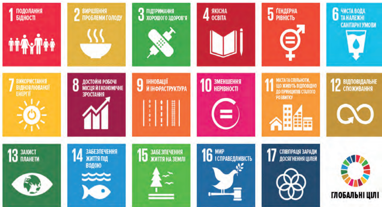
Глобальні цілі сталого розвитку 2030

Сучасний етап розвитку суспільства, в основі якого інтенсивне використання природних ресурсів, характеризується зростанням антропогенного тиску на природу. Світова спільнота вже давно зафіксувала, що частина ресурсів, наприклад мінеральних, перебуває на стадії вичерпання, стає все більше важкодоступною або з погіршеними властивостями. Частина природних ресурсів (поверхневі води, ґрунти та ін.) вже мають змінені природні екологічні властивості. Якість і можливість їх прямого використання дедалі більше впливають на умови життєдіяльності людини. Усвідомлення негативних наслідків впливу діяльності суспільства на природу показало необхідність розпочати складний процес формування нової світоглядної парадигми розвитку, котра у документі ООН “Порядок денний на XXI століття” (Ріо-де-Жанейро, 1992 р.) означена як парадигма сталого розвитку 1 .