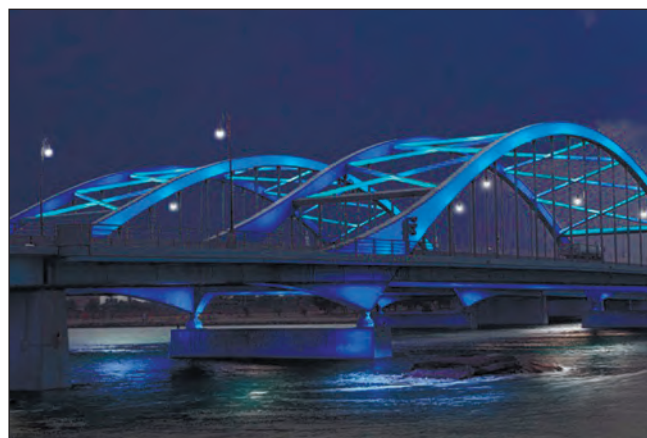
Фото 7. Міст Аль Макта зі зростанням автомобільного трафіку розширили до 4 смуг. Важливо, що при проектуванні та конструюванні мосту були враховані кліматичні особливості ОАЕ: міст розраховано на 55-градусну спеку. 2015 р.

2 грудня 1971 року після титанічних зусиль з боку шейха Заїда були засновані Об'єднані Арабські Емірати, до складу яких увійшли сім еміратів: Абу-Дабі, Дубай, Шарджа, Аджман, Рас-аль-Хайма, Умм-аль-Кувейн і Фуджейра, — за винятком Бахрейну і Катару, які проголосили незалежність після виведення британських військ.