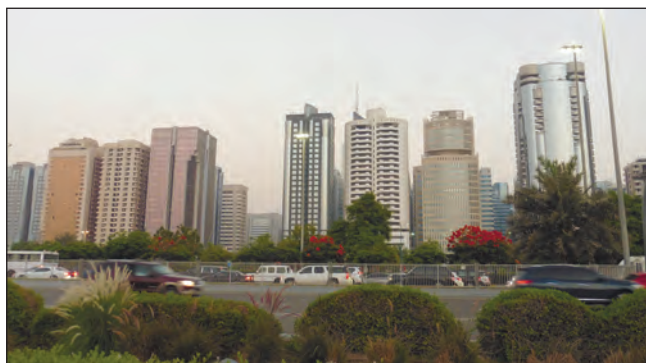
Фото 16. Перетин Корнішу і вулиці імені шейха Заїда бін Султана. 2015 р.