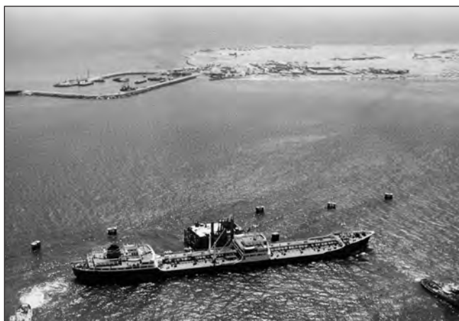
Фото 2. Британський танкер “British Signal” під час першої в історії Абу-Дабі заправки в нафтовому терміналі на о. Дас. 1962 р. Видніються ліворуч порт Міна (на початку розвитку інфраструктури порту) і праворуч — набережна Корніш [5]

У той час керував шейх Шахбут , який не ризикував мати справу з компаніями з видобутку нафти і ставився з сумнівом до такої перспективи. Наймолодший з його братів, шейх Зайд бін Султан Аль Нахайян (фото 3, [11]), навпаки уважав, що така позиція стримує розвиток Абу-Дабі.