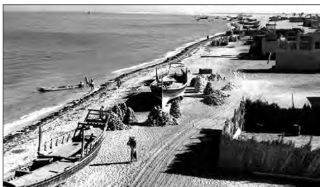
Фото 10. Вулиця Корніш в Абу-Дабі. 1940-ті роки. Традиційні хатини “барасті”, зроблені з пальмового листа. Ліворуч, на піску, стоять човники “Доу”, що використовувались, переважно, для риболовлі та ловцями перлин