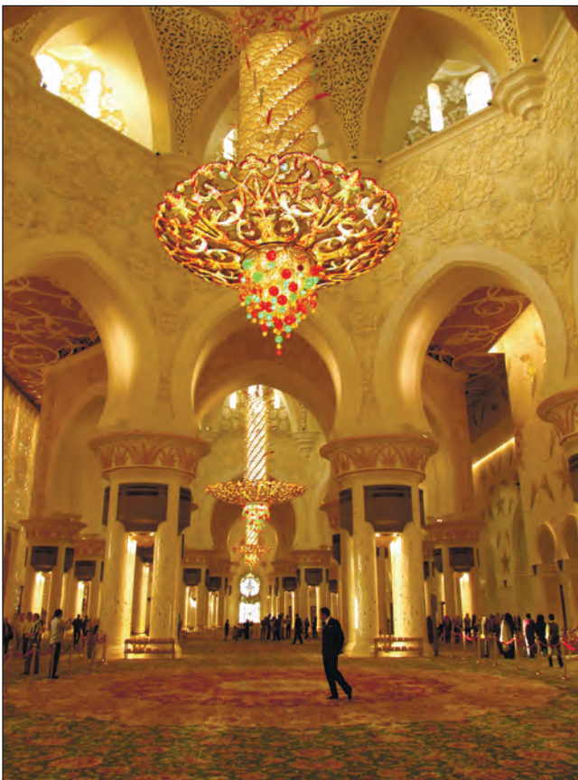
Фото 28. Килим у Білій мечеті.

По чотирьох кутах мечеті знаходяться чотири мінарети, які піднімаються приблизно на 107 м. На подвір'ї можуть розміститися до 32 тисяч людей і ще до дев'яти тисяч можуть перебувати у молельних залах. Куполи (загалом їх 82) прикрашені білим мармуром, їхнє внутрішнє художнє оформлення виконано також із мармуру, а внутрішній двір викладений кольоровим мармуром