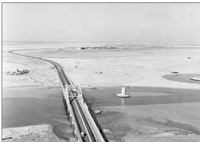
Фото 5. Перший міст, який з'єднує острів і материк. Звела його австрійська компанія Vaagner Biro. Ініціатором будівництва був шейх Заїд. Праворуч від мосту — вежа на острові Кор Аль Макта. Попереду пустельним виглядає Абу-Дабі. Приблизно 1967 р.