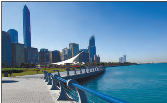
Фото 17. На Корніші розташовано два відкритих пляжі, майданчики з різними спортивними знаряддями. Ліворуч видно один із найвищих будинків Абу-Дабі — Міжнародний торговельний центр, поруч із ним розташовано “сук” (з арабської — “базар”). 2015 р., фото автора