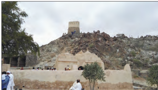
Фото 30. Найдавніша мечеть у місті Дібба. Має квадратну форму, площа — 53 кв. м. Була побудована з матеріалів, наявних в області, в першу чергу, каміння різних розмірів і глиняної цегли, покритих у багатьох шарах білого кольору штукатурки. Дах підтримуються тільки одним стовпом, розташованим у центрі. Вхід у мечеть — через двостулкові дерев'яні двері

Неординарність шейха Заїда як лідера, з погляду, наприклад, політичного устрою в Україні, полягає в тому, що за час свого правління він зумів не тільки показати, але й довести людям, що робота та піклування уряду зосереджено, перш за все, на населенні. Шейх Заїд під час свого правління заснував фінансовий фонд для інвестиційних потреб Абу-Дабі. Основний капітал було закладено від продажу нафти. Відомо, що раз на місяць корінний араб ОАЕ може записатись на прийом до шейха Каліфу (син шейха Заїда і президент ОАЕ нині) щодо особистих питань. Еміратці називають шейха Заїда батьком. На вулицях можна зустріти багато біг-бордів із його портретами.