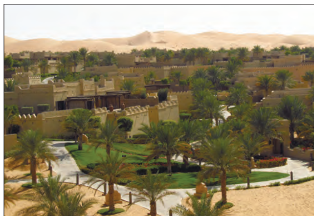
Фото 23. Повністю штучний оазис у Ліві — готель у вигляді форту з оазисом посеред пустелі