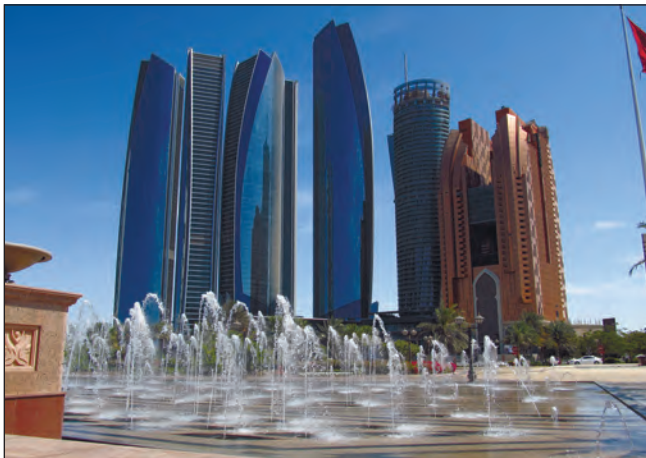
Фото 14. Вежі “Етіхад”. Завдячують своїй назві державній авіакомпанії ОАЕ. 2015 р., фото автора