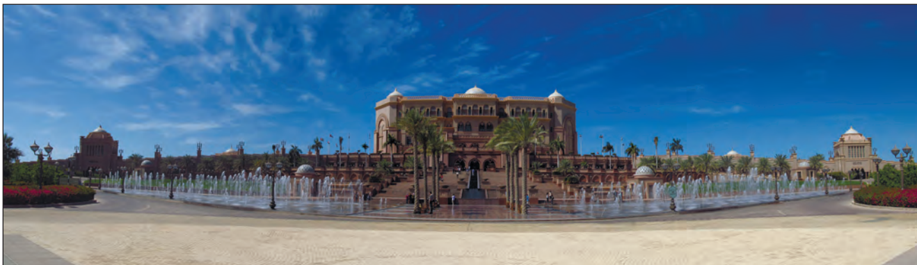
Фото 18. Семизірковий палац Еміреїтс в Абу-Дабі (західна частина Корнішу). Поряд знаходиться палац шейха (заборонено фотографувати зблизька) та Маріна-мол — величезний торговельний комплекс. 2015 р.