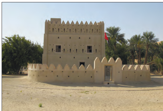
Фото 22. Один із оазисів у Ліві, де розташовано маленький форт, що охороняє оазис, — природні місцевини, де рівень підземних вод вищий відносно поверхні