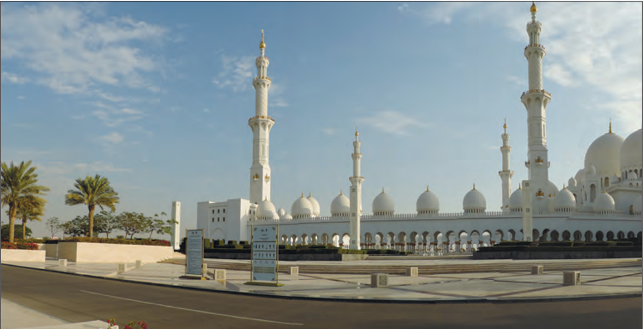
Фото 27. Велика мечеть імені шейха Заїда або Біла мечеть.

По чотирьох кутах мечеті знаходяться чотири мінарети, які піднімаються приблизно на 107 м. На подвір'ї можуть розміститися до 32 тисяч людей і ще до дев'яти тисяч можуть перебувати у молельних залах. Куполи (загалом їх 82) прикрашені білим мармуром, їхнє внутрішнє художнє оформлення виконано також із мармуру, а внутрішній двір викладений кольоровим мармуром