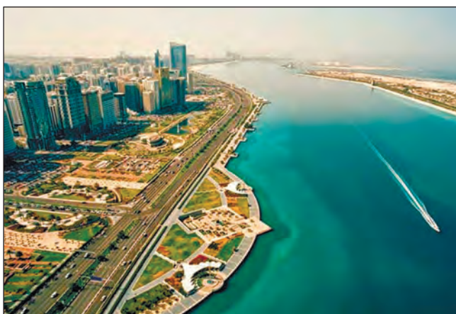
Фото 13. Набережна Корніш у 2000-х роках. Праворуч — штучний острів Лулу

Тож, на час створення ОАЕ, міністрам першого федерального уряду було понад тридцять років. Їм довелося вести нелегку боротьбу з пережитками, бо населення зі своїми проблемами звикло звертатися до вождя племені, а не до офіційних бюрократичних державних установ. Особливо великі труднощі виникли через необхідність заручитися довірою кочових племен пустелі, яких релігія і культура закликали служити тільки двом силам — Аллахові і вождю племені. Крім того, хоча емірати перебували на невеликих відстанях один від одного, інформаційна ізоляція до об'єднання була повною.