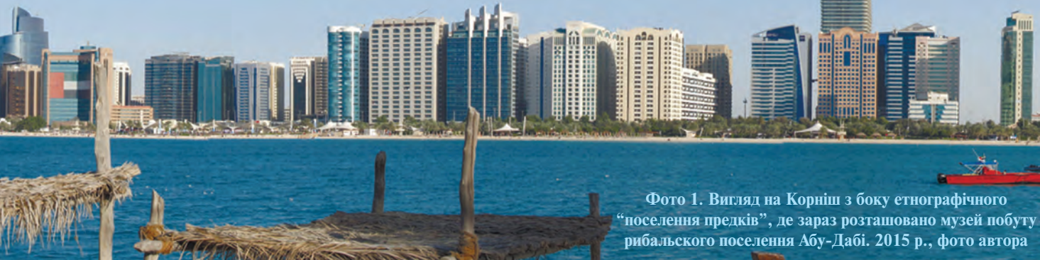
Фото 1. Вигляд на Корніш з боку етнографічного “поселення предків”, де зараз розташовано музей побуту рибальського поселення Абу-Дабі. 2015 р.

в 100 км на північний захід від острова Абу-Дабі. На острові Дас, розташованому за 180 км від берега, видобуток почався в 1962 р. і проходив під контролем “Abu Dhabi Marine Areas Ltd” [7]. Саме у 1962 р. танкер “British Signal” вперше заповнив у нафтоналивному терміналі свої резервуари чвертю мільйона барелів сирої нафти (фото 2) і взяв курс на Японію [5]. Пізніше в 1963 р. пішла наземна нафта з родовища Баб, яку перший танкер “Esso Dublin” доставив на нафтоперегінний завод в Уельсі. Нагадаємо, що основні нафтові поклади припадають на морську територію емірату, де вона відразу ж завантажується на танкери. Тому сьогодні, проїжджаючи еміратами ОАЕ, складно знайти урбаністичні види з нафтовими полями, звідки вишки качають нафту.