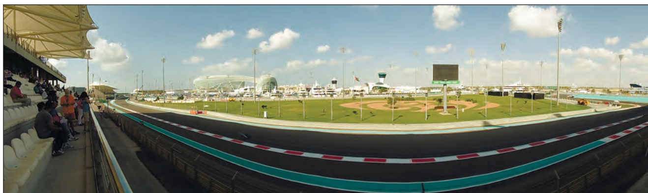
Фото 25. Траса “Яс Марина” в очікуванні вечора, коли почнеться старт Гран-Прі Абу-Дабі з автоперегонів класу “Формула 1”. Щовівторка кожен охочий може відвідати трасу, щоб проїхатись байком, проїбгті або пройтися пішки під музику, що лунає з динаміків.