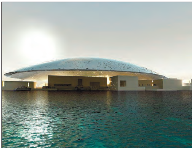
Фото 25. Проект філіалу Лувра в Абу-Дабі. Станом на 2015 рік купол та дороги до нього були вже збудовані.

У 1980-х роках, в умовах значного коливання цін на нафту, економіка, що сильно залежала від нафтового ринку, переживала злети і падіння. Поступово почала утворюватися сучасна інфраструктура, а також робилися перші спроби послабити залежність від нафти. Ці зміни знаходили своє відображення в силуеті міста, що ріс угору з появою нових висотних офісних і житлових будівель.