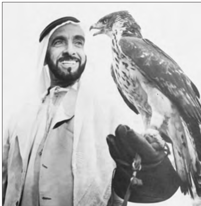
Фото 3. Шейх Зайд бін Султан Аль Нахайян. Однією з пристрастей шейха було полювання з соколом. Для бедуїнів таке полювання давало змогу отримати їжу в пустелі (зайці, птахи тощо). Сьогодні в Абу-Дабі працює одна з провідних у світі клінік із лікування птахів [11]

У результаті сімейних перемовин 6 серпня 1966 року керувати еміратом починає Зайд бін Султан Аль Нахайян . Шейх, який вів кочове життя бедуїна і ніколи не відвідував школу, а освіту здобув за Кораном, зробив перші кроки, щоб вивести емірат із похмурого середньовіччя. Шейх Зайд не мав університетської освіти, але саме він взяв курс на створення сучасної інфраструктури та створення умов комфортного життя для мешканців емірату. Лише сорок років тому місцеві бедуїни вели примітивний побут кочівників, боролися за фізичне виживання між безплідною пустелею і морем. Вони не мали власних грошей, не носили взуття, не знали міст, годинників, мила та рушника. Вони знали одного господаря — шейха —