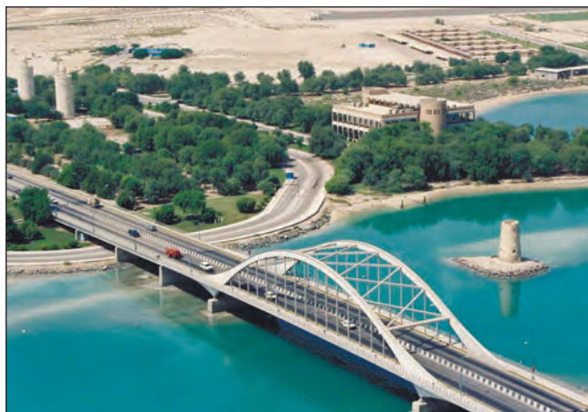
Фото 6. Відреставрована вежа на острові Кор Аль Макта. 1970-ті роки

та одну книгу — Коран. Найбільшими цінностями для них були верблюд, фінікова пальма і море, де добувалися перли. Недарма в музеї-форті Аль Фаджілі, що в Дубаї, цілі зали відведені на експозицію побуту ловців перлів на човнах Доу, верблюжим базарам і зображенню життя в оазисах пустелі [8]. Ще у 1950-х роках мешканці Абу-Дабі не мали лікарень і шкіл, крім релігійного медресе, де був один учитель-мулла. Абсолютна більшість була безграмотною, одиниці вчилися за Кораном. Бедуїни не задокументували історичні події, не вели реєстрацію народжень, смертей і шлюбів. Навіть договори не реєструвалися належним чином, — у результаті цивілізовані європейці часто обманювали місцевих вождів. Перша світська школа була відкрита в 1959 році. Перші списані військові вантажівки і всюдиходи з'явилися в другій половині 1950-х років [2].