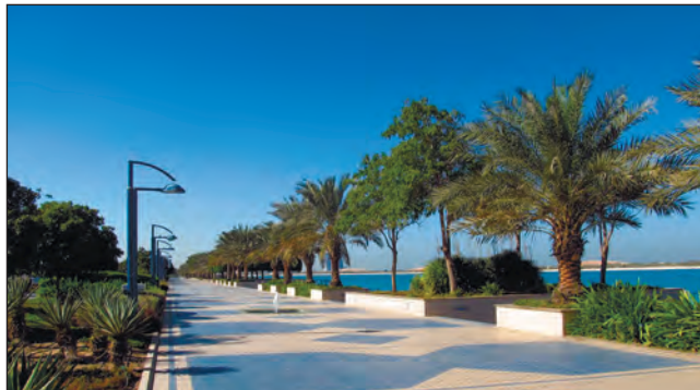
Фото 15. На Корніші поряд із пішохідною частиною є велодоріжка. 2015 р.