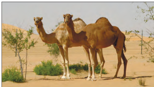
Фото 21. Верблюди дорогою до Ліві, які випадково вийшли за загороження. Між деревами та кущами можна помітити чорні трубки для підведення води