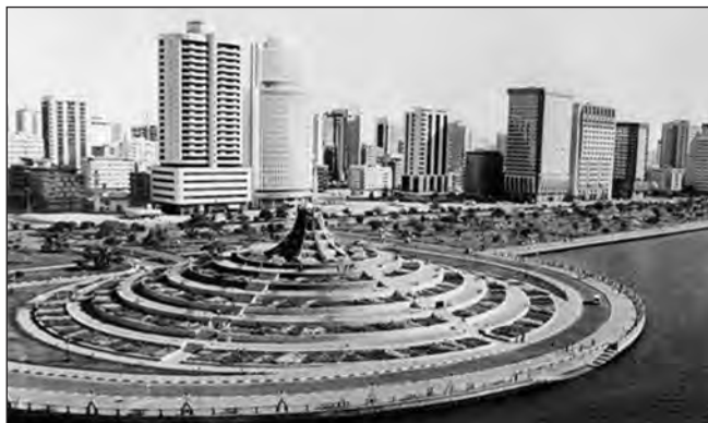
Фото 12. Вулиця Корніш у 1988 р. Фонтан “Вулкан”