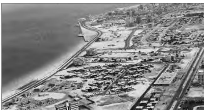
Фото 11. Перші будівлі на Корніші в Абу-Дабі. 1970-ті роки. “Корніш” з арабської — набережна, тож, наприклад, в Омані, Катарі завжди є вулиця з назвою Корніш, що свідчить про її сусідство з водою