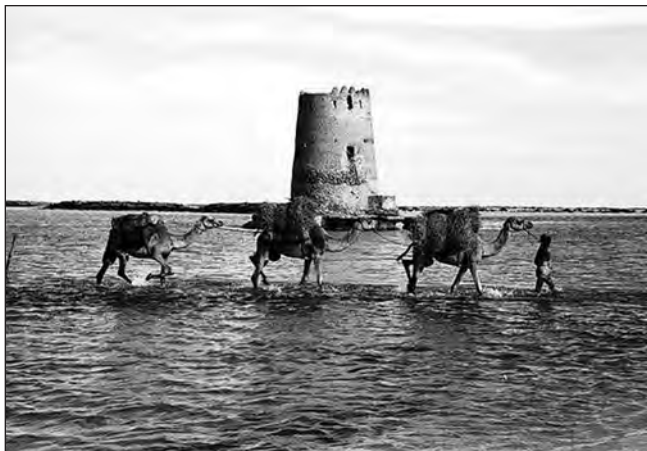
Фото 4. Сторожева вежа на острові Кор Аль Макта. Звідси походить і назва каналу, який відокремлює острів Абу-Дабі від материка. Цьому об'єкту понад 200 років. Ще у 1960-х тут несли дозор солдати, охороняючи острів від грабіжників. Майже по центру вежі розташований єдиний вхід—вихід. Загарбник не міг легко потрапити до вежі, оскільки вхід розташовувався високо. Охорона ж мала щось на зразок мотузкових сходів, якими мала змогу спуститися на землю. 1930-ті роки