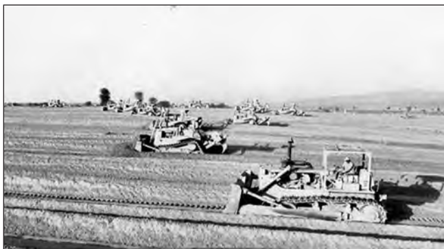
Фото 20. Трансформація пустелі у зелені ліси, що розпочав шейх Зайд у 1960-х роках

Лише три покоління тому західний край острова Абу-Дабі містив лише хатини “баласті” і не мав ані зелених насаджень, ані доріг. А сьогодні це — один із найдорожчих в світі районів. Довжина вулиці Корніш становить приблизно 8 км, до 20 % території вулиці вкрито зеленими насадженнями (фото 14—19).