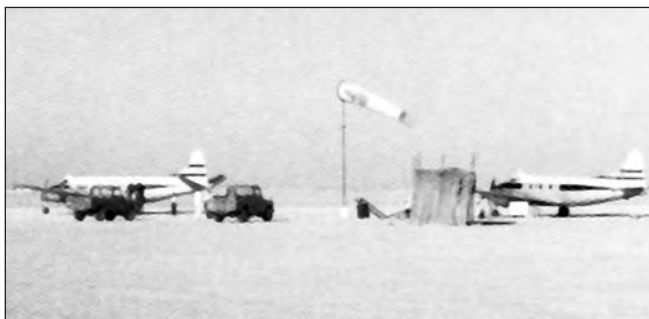
Фото 8. Аеропорт в Абу-Дабі. 1963 р. Тепер в Абу-Дабі функціонують два аеропорти: старий, що розташовано на острові Абу-Дабі (Аль Батин) і який обслуговує чартерні рейси; міжнародний, що розташований в 30 хв. їзди від острова Абу-Дабі