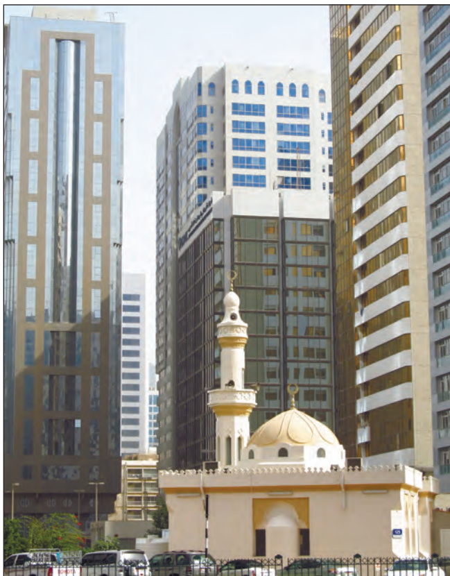
Фото 29. Класичні маленькі міські мечеті мають один мінарет і виконані в блідожовтому кольорі. Якщо мечеть велика, то вона має або два, або чотири мінарети, відкриту площу та зали для молитов

По-справжньому переваги прав жінки у свободі, ніж чоловіка, можна відчутти і побачити, відвідавши ОАЕ не як турист. Як приклад, — спеціально відведені частини місць в транспорті, куди чоловік не може зайти, пляжі, деякі ресторани тощо. В Дубаї на автостанції мені треба було купити квиток на автобус. Підійшовши до каси, я вже збиралася стати в чергу, коли до мене підійшов охоронець і запросив до окремої черги (вони їх розділяють стрічками). Віконце було єдине, але тільки-но я підійшла, як черга з чоловіків відступила від віконця. В залах очікування виділені окремі зони для жінок.