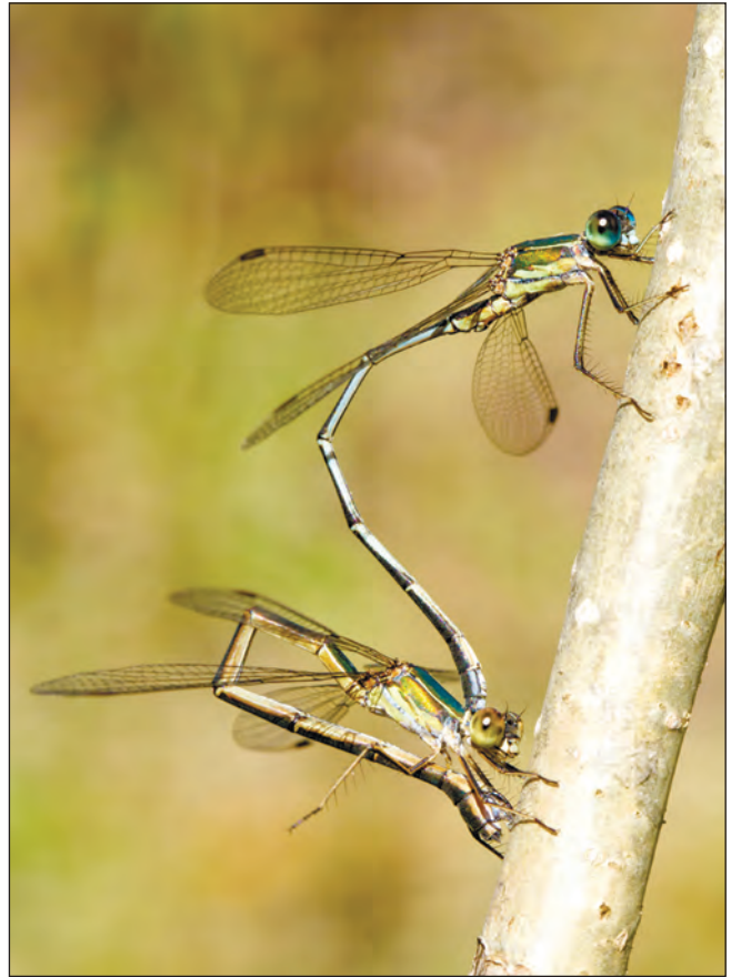
Микола Борисенко. Фото зверху: відкладання яєць бабками Chalcolestes parvidens ; фото знизу: око сірої ропухи