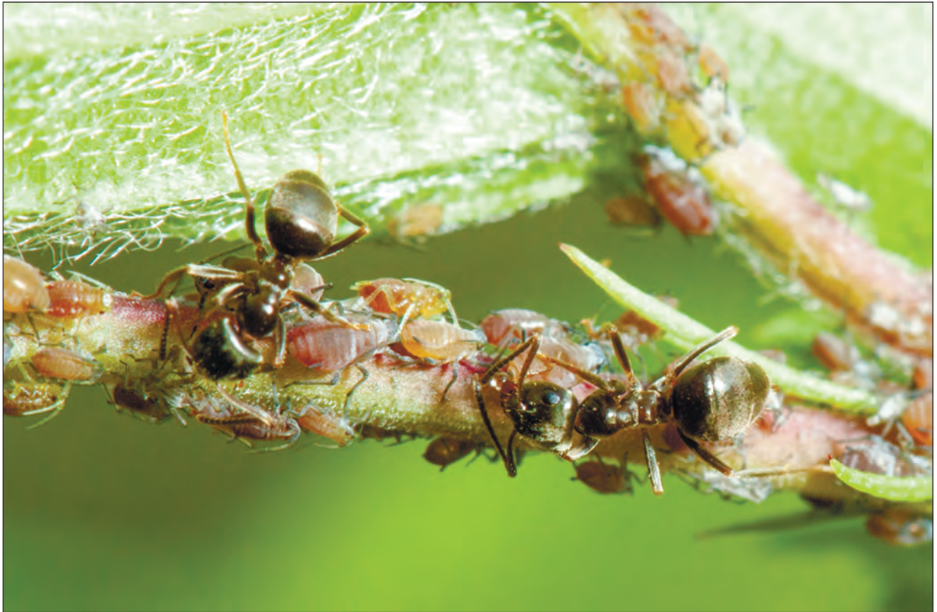
Микола Борисенко. Фото зверху: мурахи Lasius niger збирають солодкі виділення попелиць; фото знизу: нічне скупчення самців бджіл Melitta leporina