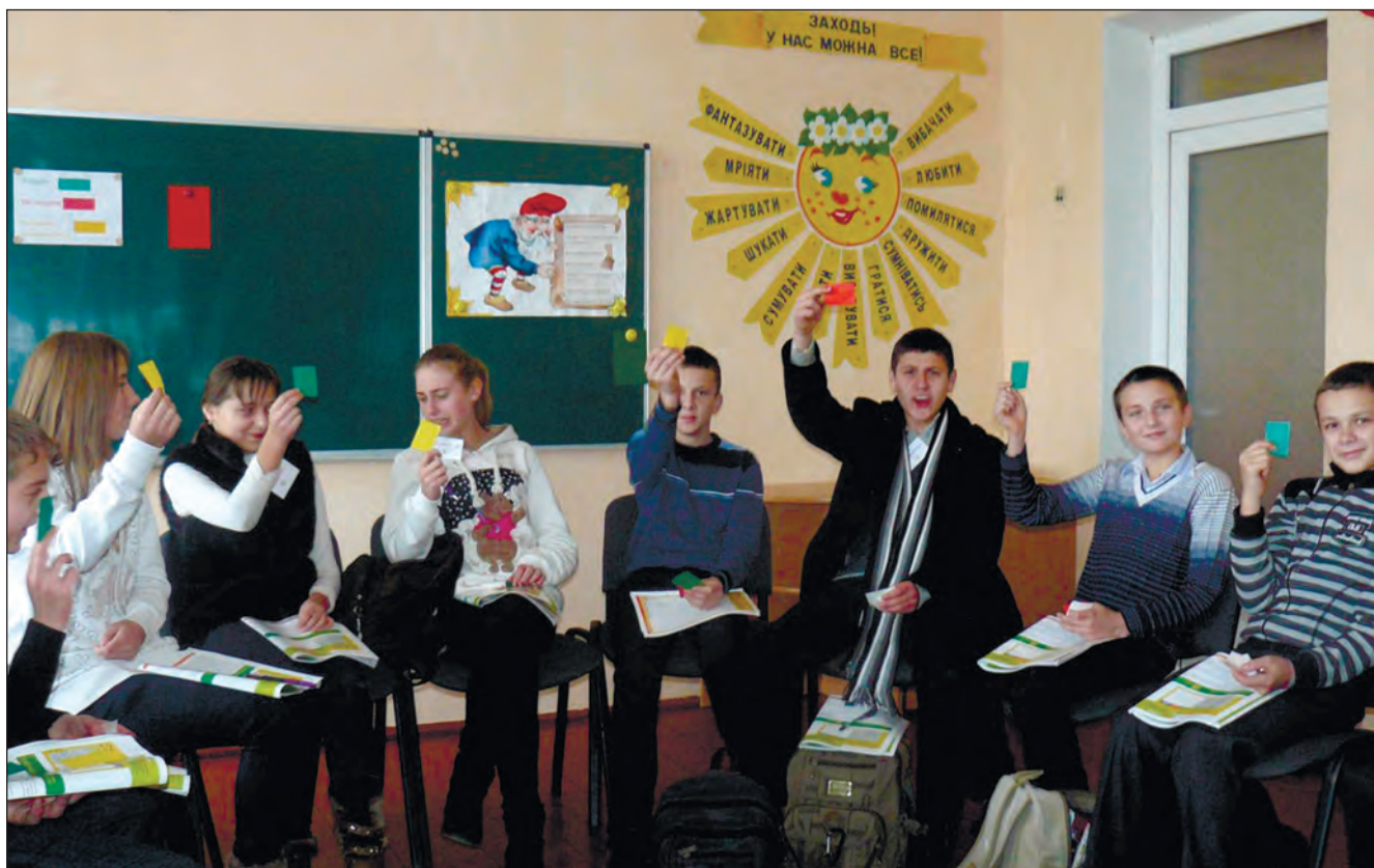
Впровадження розробленої Українським НМЦ практичної психології і соціальної роботи НАПН України Інформаційно-освітньої протиалкогольної програми “Сімейна розмова” у Старововчинецькому ліцеї (с. Старий Вовчинець, Глибоцького району Чернівецької області)

Під “іншими видами роботи” респонденти мали на увазі в основному такі види роботи: участь у благодійних акціях і виховних заходах, що проводяться у