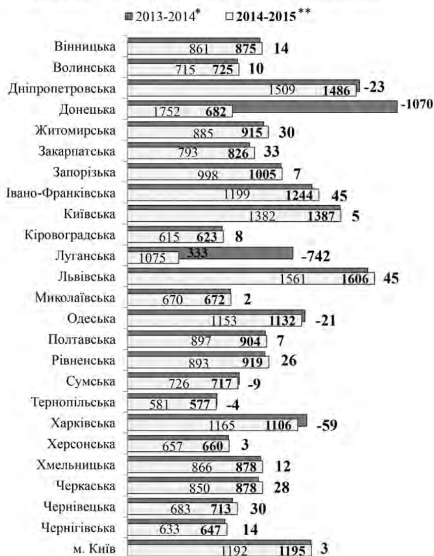
Розвиток психологічної служби системи освіти України у регіонах (кількість фахівців порівняно з минулим навчальним роком)

Що ж стосується методичного керівництва (запровадження стандартів змісту освіти, планування