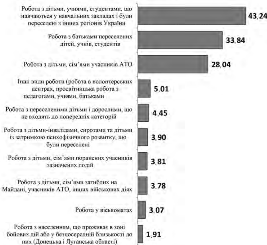
Рис. 2. Кількість працівників психологічної служби освіти України, задіяних у наданні допомоги громадянам України, які виїхали з АР Крим та Сходу України