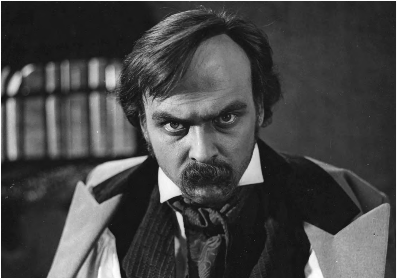
Іван Миколайчук (1941—1987) — український кіноактор, кінорежисер, сценарист — у ролі Тараса Шевченка (“Сон”, 1964 р.)