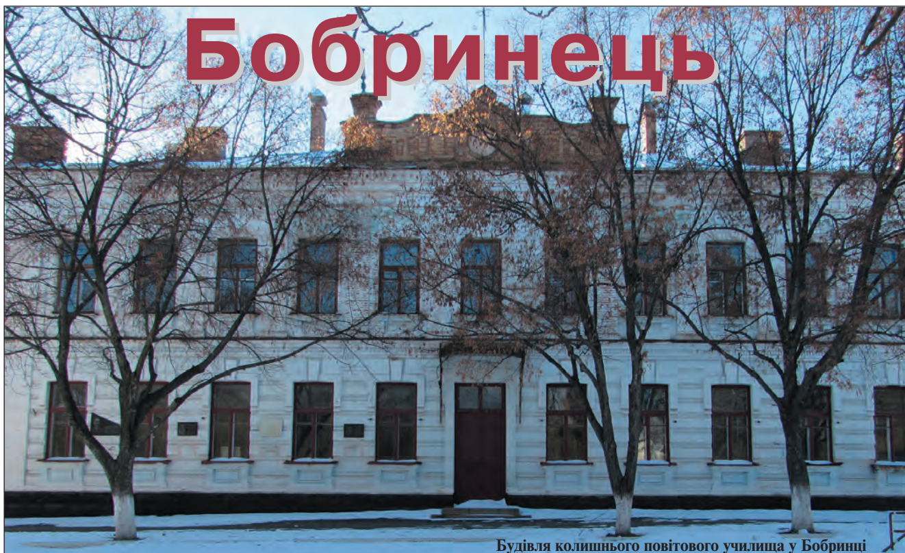
Будівля колишнього повітового училища у Бобринці