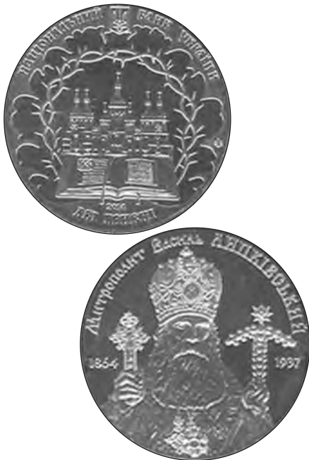
Національний банк України 27 листопада 2014 року ввів в обіг пам'ятну монету, присвячену 150-річчю від народження Митрополита Василя Липківського