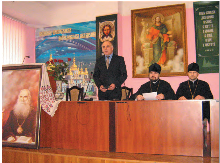
Урочистий вечір до 150-річчя від народження Митрополита Липківського в актовій залі Київської православної богословської академії (КПБА). Київ, 19 березня 2014 року

Того ж дня в Андріївській церкві відбулося богослужіння — Акафіст до священомученика Василя (Липківського), Митрополита Київського і всієї України (1937+), бо у травні 1997 р. Третій Помісний Собор УАПЦ здійснив канонізацію святих новомучеників землі Української, зокрема Митрополита Василя Липківського.