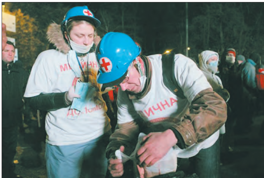
Медики під час подій в Києві у лютому 2014 р. показали неймовірну самоорганізованість.

Іноді здоров'я ототожнюють з відсутністю захворювань. Це не зовсім правильно. Існує багато прикладів перемоги людей над своїми недугами, фізичними вадами. Зокрема, дивовижний приклад Ніка Вуйчича , 30-річного австралійського мільйонера, який народився без рук і ніг. У своїх спогадах він пише, що не раз хотів покінчити з життям, але під час навчання в університеті переборював себе й виступив перед слухачами. Це було початком його кар'єри професійного оратора. Він відвідав десятки країн, його чули мільйони людей. У своїх виступах Нік завжди повторює: "в житті буває, що Ви падаєте і, здається, підвестися немає сили. Не здавайтеся, пробуйте знову і знову. Невдача — це не кінець. Головне — не те, що Ви впали, головне те, що Ви в результаті підніметься". Сильні духом люди кидають виклик діагнозам та безпорадності, знаходять своє місце й призначення. Так, вони хворі фізично, але їхній дух не зломлений, тобто, здоровий.