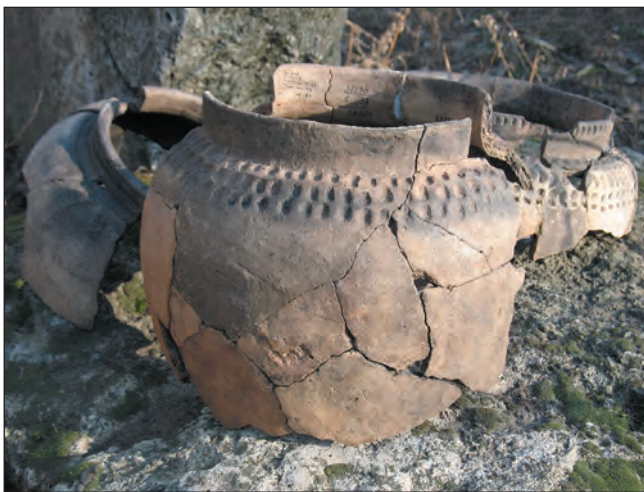
Кераміка ямної культури. Генералка-2, острів Хортиця