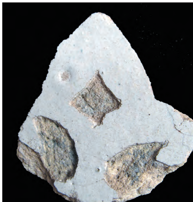
Ординська мозаїка. Кінські води

Даний проект — спроба повернути улюбленій справі простоту і привабливість. Десять років роботи "Нової археологічної школи" унаочнюють творчий синтез педагогіки й археології. Під час літньої експедиції відбуваються екскурсії, лекції, ігри та конкурси. Але, разом з цим, польовий табір "Нової археологіч-