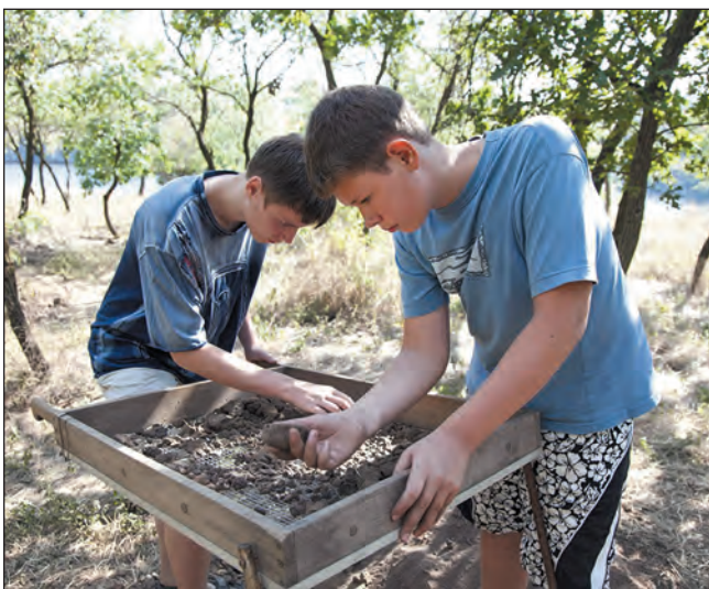
На розкопках унікальної пам'ятки ямної культури на острові Хортиця — Генералка-2

При цьому польові та лабораторні дослідження істотно перетинаються зі суміжними дисциплінами — історією, краєзнавством, програмуванням, психологією, реставрацією та іншими. Знахідки не подаються як мертві предмети за склом, вони є постійним джерелом нової інформації, кроком до знання про минуле. За десять років матеріали з розкопок, здійснених за участю "Нової археологічної школи", не стали мертвими наповнювачами музейних фондів. Їх активно використовують під час написання звітів, а також у інформаційних проектах. Учасники НАШ щороку здобувають призові місця на конкурсах Малої академії наук.