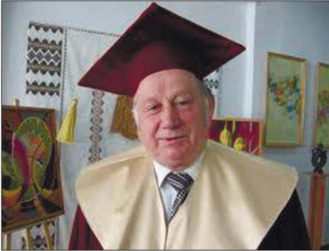
Іван Климишин доктор фіз.-мат. наук, академік АН ВШ України, професор Прикарпатського національного університету ім. Василя Стефаника, професор Івано-Франківської Теологічної Академії Греко-Католицької Церкви, м. Івано-Франківськ

17 січня 2013 року виповнилося 80 років Івану Антоновичу Климишину — талановитому вченому-астрофізику, видатному педагогу та автору багатьох наукових та науково-популярних видань (а таких добігає майже 100). Мала планета №3653 названа його іменем. Редакція "Світогляду" вітає Івана Антоновича з цією знаменною датою та зичить ювіляру доброго здоров'я та творчої наснаги ще на довгі роки життя! У цьому числі журналу подаємо статтю І.А. Климишина та його прохання до колег та читачів журналу обговорити актуальні теми сьогодення.