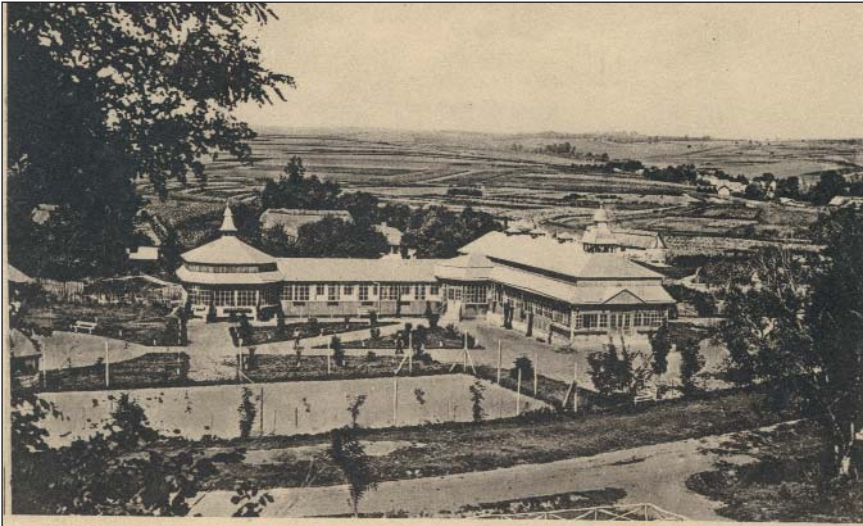
Черче. Лазнички і заг. вид.