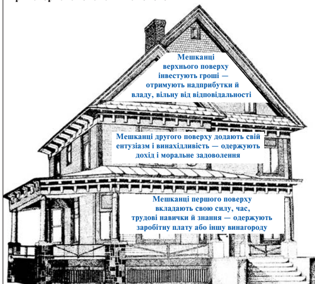
Рис. 2. "Архітектурний ескіз" триповерхової економічної системи

Понад два тисячоліття тому Аристотель описав деякі методи, які дозволяли торговцям отримувати гроші "із грошей". Європейські королі доволі часто зверталися до послуг лихварів, пізніше — банкірів. Релігії, християнська й інші, ставилися до цього виду діяльності по-різному, іноді засуджуючи або навіть забороняючи її, іноді — терплячіше або навіть зі схваленням. Так чи інакше, нинішній вражаючий, скоріше, навіть агресивний бум "третього поверху" економіки — це об'єктивно існуюче явище, що дуже сильно впливає на процеси в людському суспільстві не тільки в галузі економіки, але також і в соціальній та політичній сферах.