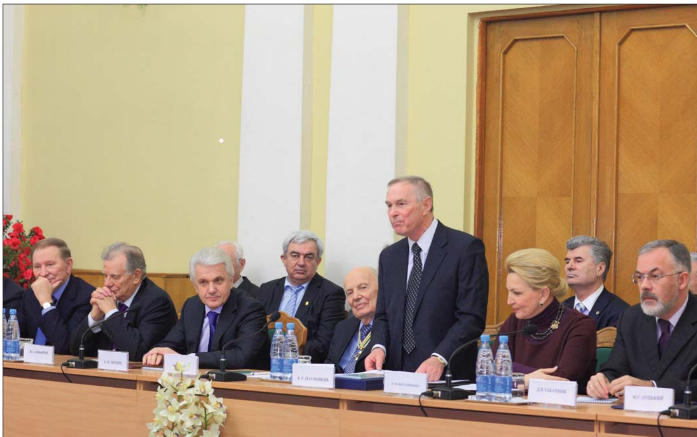
У президії урочистого зібрання.

Вступне слово віце-президента НАН України академіка А.Г.Наумовця