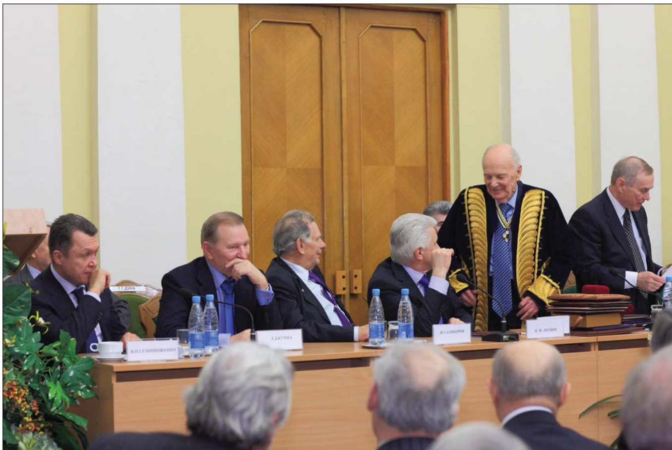
Б.Є. Патон приміряв казахський чапан — подарунок президента АН Республіки Казахстан М. Журинова.

Слова подяки Героя України, президента НАН України Б.Є. Патона усім присутнім