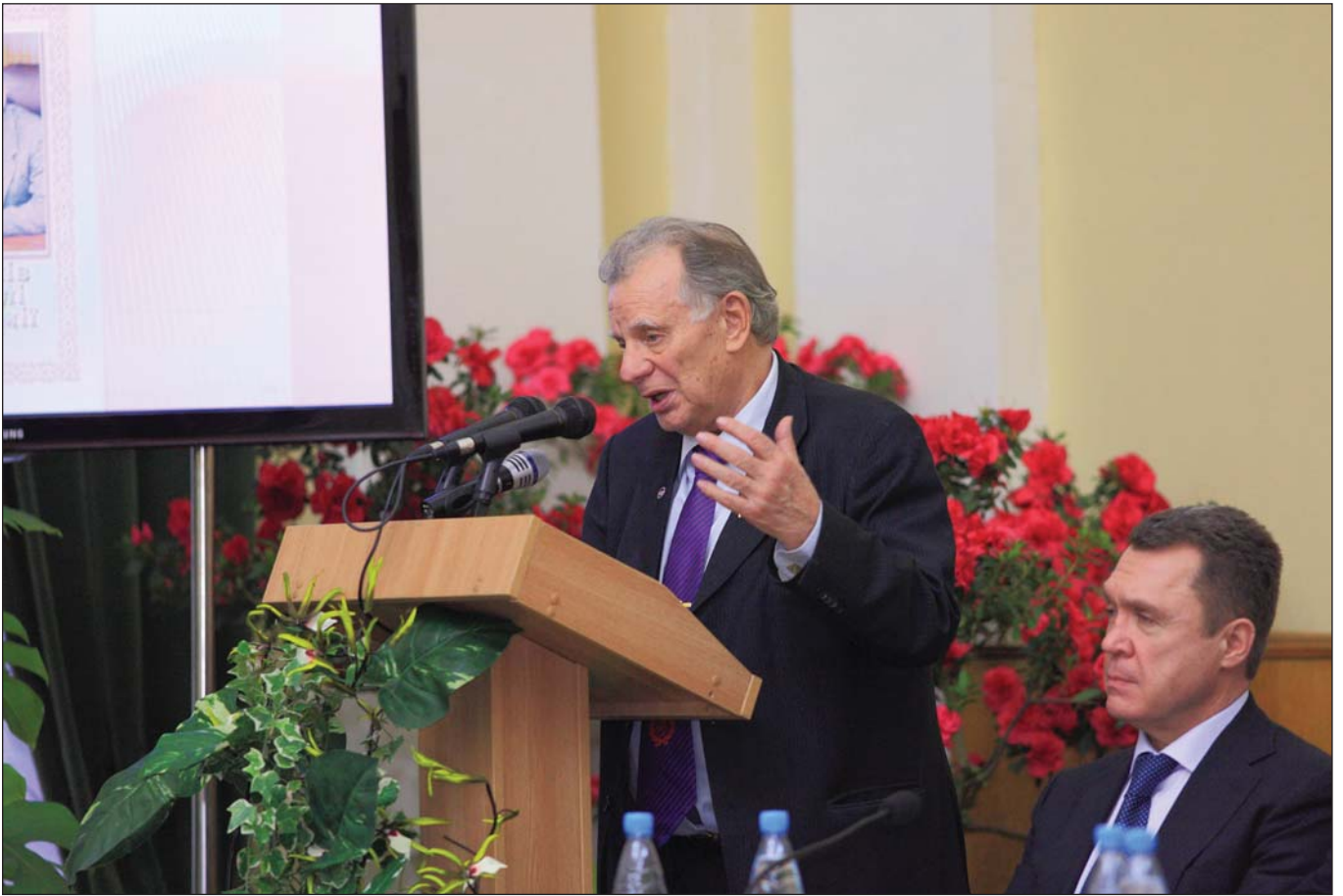
Ювіляра вітають: Нобелівський лауреат, академік Російської АН Ж.І. Алфьоров, Герой України, академік НАН України Б.І. Олійник