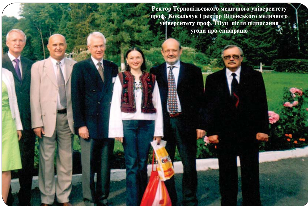
Ректор Тернопільського медичного університету проф. Ковальчук і ректор Віденського медичного університету проф. Шуц після підписання угоди про співпрацю

http://www.tdmu.edu.te.ua/ukr/news/austria_stud.htm