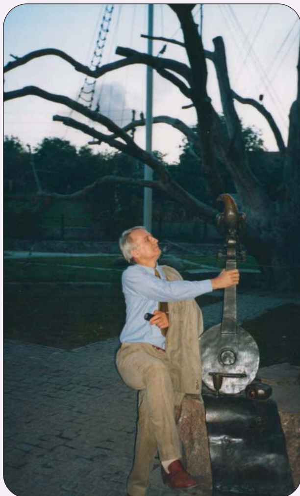
Взяв би я бандуру ...

Читаючи лекції для організаторів охорони здоров'я, я дуже часто наводжу приклад цього робочого дня хірурга, видатного вченого. Яка напруженість робочого дня. Які професійні, та людські якості у цієї людини. Як знає і любить Україну, як допомагає колишнім землякам, бо хоче, аби українська медицина, життя українців досягли європейського рівня.