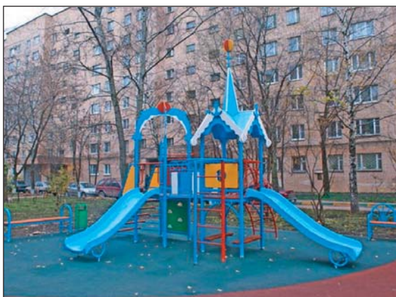
Рис. 4-6. Життя, яким воно є: ось і такі дитячі майданчики є у Києві