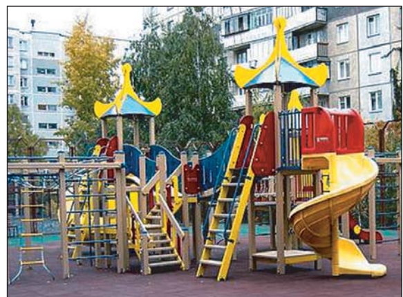
Рис. 7-8. Такий дитячий майданчик — це також права, права дитини ( http://www.mos-kompani.ru/index.php , http://static.baza.farpost.ru/bulletins_images/2/1/9/2190604.jpg )