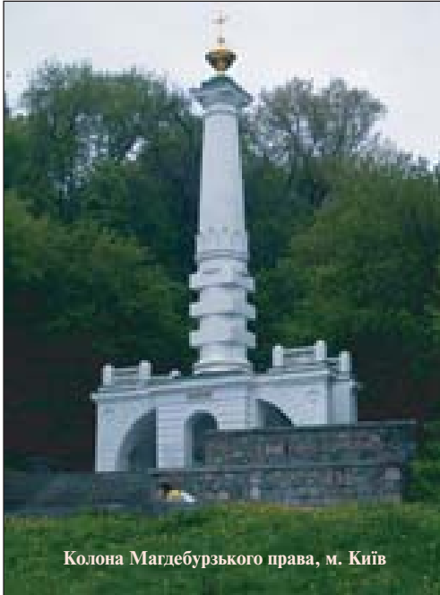
Колона Магдебурзького права, м. Київ

смерть — у рамках цих життєвих циклів в основному триває життєдіяльність місцевого співтовариства.