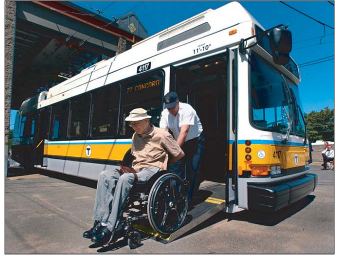
Рис. 2, 3. Місцева влада та права інвалідів: як воно є ( http://img.nr2.ru/pict/arts1/r91/dop1/09/05/67.jpg ) і як воно має бути ( http://msnbcmedia.msn.com/i/MSNBC/Components/Photo/_new/g-cvr-090826-accessible-6p.jpg )

ально-психологічна недоторканність особи, недоторканність приватного життя, недоторканність житла, інформації про особисте життя тощо), а конституційне значення поняття "недоторканність" безпосередньо пов'язане з політичним владарюванням. Рівень гарантованості та забезпечення захисту права на свободу та особисту недоторканність визнається показником демократизації суспільства і є важливим складником становлення правової державності. Саме тому, виходячи зі ст. 3 Конституції України, однією із засад конституційного ладу є обов'язок держави утверджувати і забезпечувати права людини.