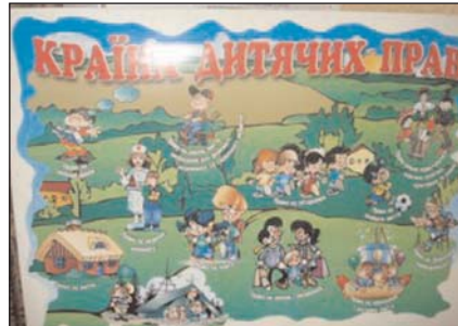
Рис. 15. Права людини починаються з прав дитини