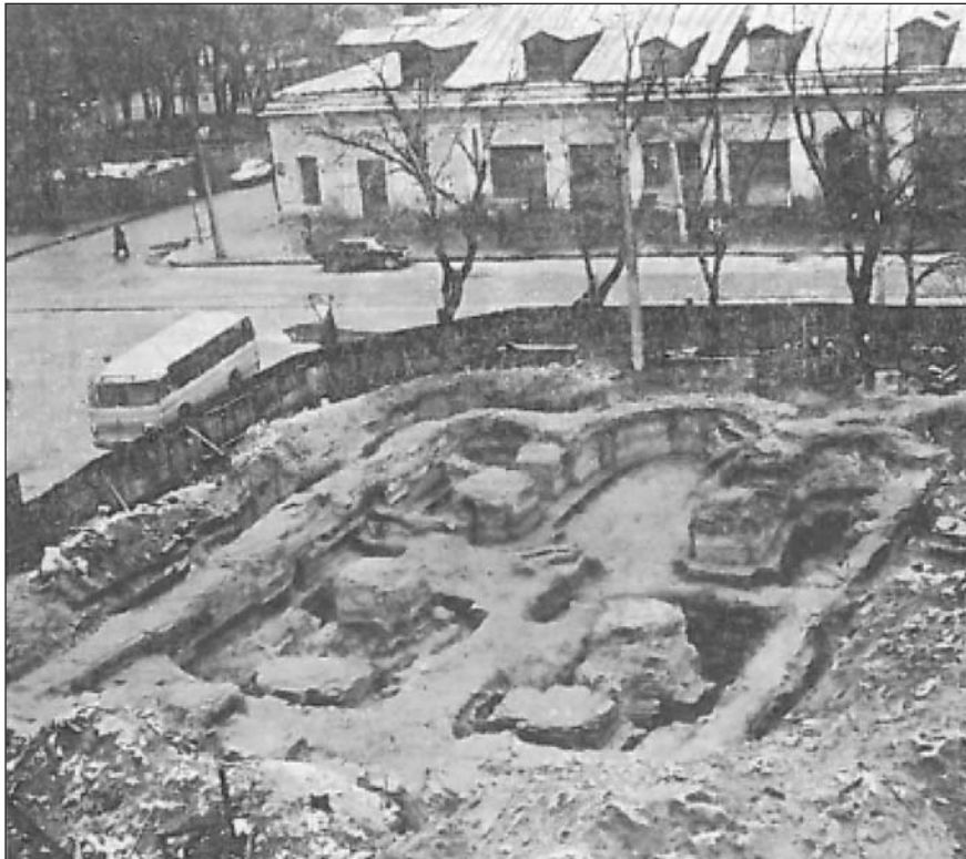
Рис. 3. Залишки фундаментів і стін церкви Успіння Богородиці Пирогощі

ній". Розташований під вул. Хорива на відмітку між її перетином з вул. Почайнинською та Набережно-Хрещатицькою. Північна його межа — берег літописної р. Почайни, південна — русло Ручая. Поховання, знайдені на його території, датовані першою половиною — серединою XI ст.