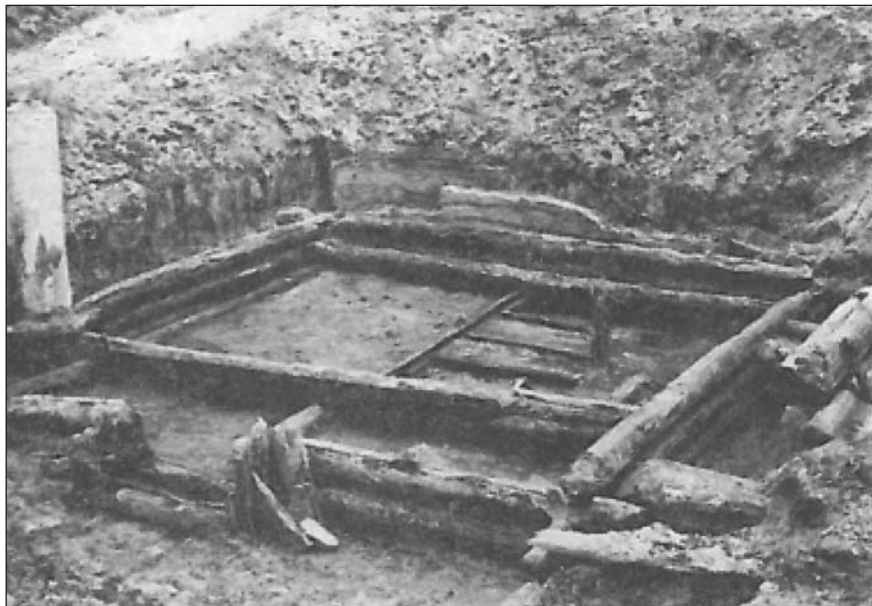
Рис. 2. Розкопки на території Житнього базару. 1973 р.

У 1985 р. співробітники Подільської експедиції проводили дослідження по вул. Оболонській, 23-27 і Костянтинівській, 61. Ці розкопки продемонстрували велику потужність культурних нашарувань XVII-XVIII ст., розкрито частину міського кварталу XII