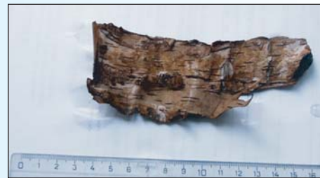
Шматок кори берести XII ст., вперше знайденої в Києві. Дослідження присутності на ній записів тривають...

Доки на цьому місці не розпочалося будівництво готельного комплексу, археологи пробрили декілька шурфів, пройшовши близько 20 горизонтів (археологічних прошарків різних історичних періодів). Завдяки тому, що ґрунт виявився сухим, вдалося пробити шурф глибиною 7 м (нижче прошарку ґрунтових вод), що відповідає прошарку XI-XII ст., і знайти останки стародавньої садиби XII ст. Можливо, в цьому будинку мешкав воїн, оскільки серед знахідок веоикої кількості кераміки і скляного браслета, було знайдено точильний брусок із дрібнозернистого сланця з вітвором посередині (щоб носити на поясі в військових походах для заточування меча). Але головною знахідкою стала берестяна грамота (?), яку вперше знайдено в Києві.