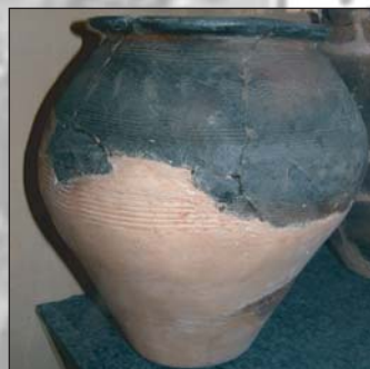
Зразки археологічної “празької культури”, дослідженої І. Борковським