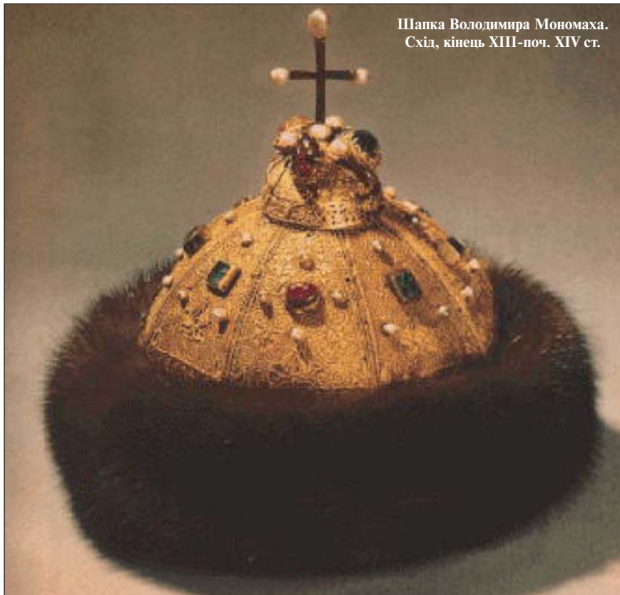
Шапка Володимира Мономаха. Схід, кінець XIII-поч. XIV ст.

пластин (вищих), інкрустована коштовними каменями і облямована хутром. Проте, шапка Мономаха більша, ніж Казанська шапка, нагадує традиційний головний убір мусульман-ординців — така (увійшло в російську мову під назвою “таф’я” — ймовірно, у зв’язку з тим, що в письмовому вживанні із арабського написання випала одна крапка над буквою “каф”, яка тим самим перетворилася на букву “фа”).