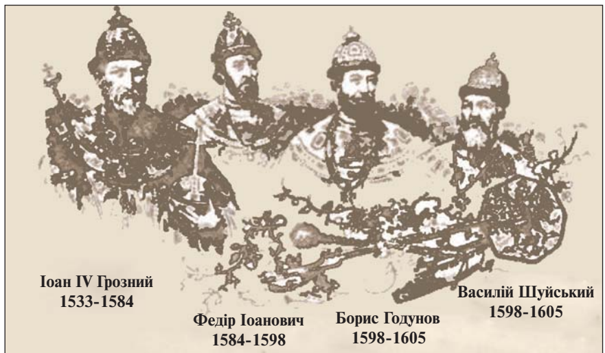
Іоан IV Грозний 1533-1584