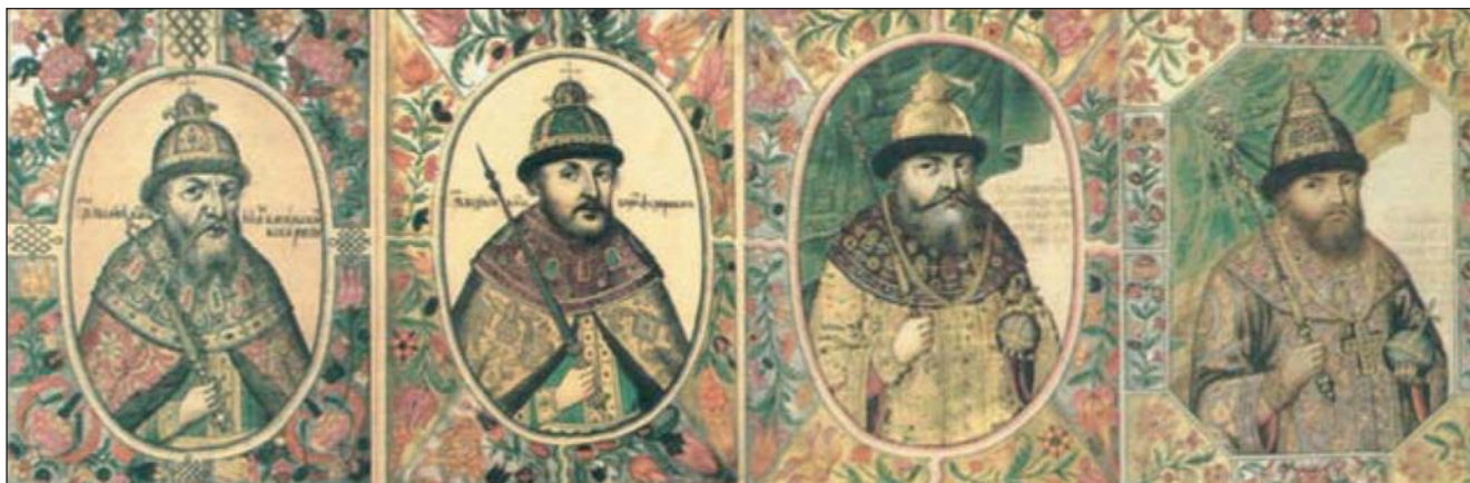
Першим із великих князів вінчався на царство Іоан IV (1530-1584), Іван Грозний.