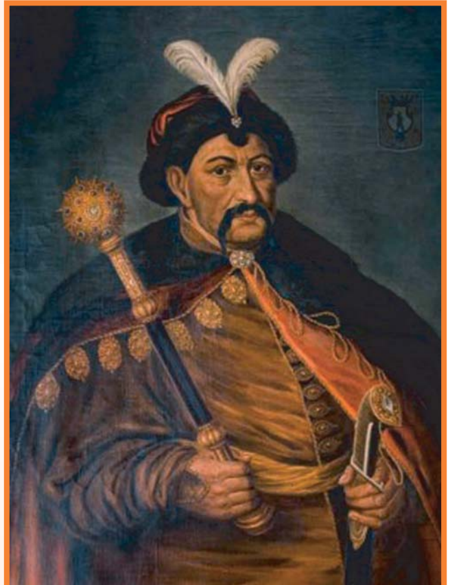
Прижиттєвий портрет Богдана Хмельницького. Чернігівський історичний музей ім. В.В. Тарнавського

Відчуження від духовної спадщини княжої доби підживляло ґрунт для концепції про вічну демократичність нашої культури, відсутність у ній аристократичного духу. Та це відчуження завдало нам ще більшого удару. Козацькі війни закінчувалися, як правило, поразками, тому українці бачили героїзм у трагедії. У нас панував героїзм мучеників. Героїзм трагічного Берестечка, а не героїзм переможного Конотопа. Від цього один крок до ідеології поразенства, зневіри у власні сили. Наша історія зводилася до зради, запродавства, братовбивства і дітовбивства. Шевченків Гонта вчинив як патріот, коли не пожалів рідних маленьких синів. А може він вбивав майбутнє нації? Гайдамацький ватажок не утруднював себе спробами перевиховати дітей, повернути до свого народу. Гоголь вилив свій біль у таких словах повісті "Страшна помста": "Людина без чесного роду й потомства — як хлібне зерно, кинуте в землю і загине марно в землі. Сходу немає — ніхто не знатиме, що кинуте було насіння".