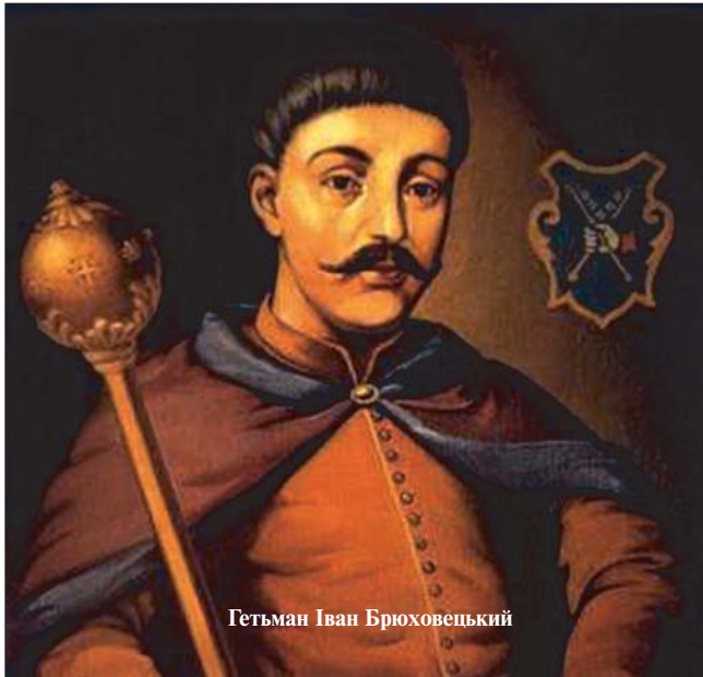
Гетьман Іван Брюховецький

порядковувалися українському гетьманові. За поданням гетьмана по 100 козаків з кожного полку “без будь-яких труднощів” набували шляхетської гідності, що мало велике значення для формування національної аристократії. Велике князівство Руське створювало свій окремий трибунал. Виконавча влада належала гетьманові, якого затверджував король з чотирьох кандидатів, обраних всіма станами (козаками, шляхтою і духовенством), а також “осібним канцлерам, маршалкам і підскарб'ям з правами сенаторів, і іншим урядам народу Руського”. Україна мала право на власний скарб (фінанси) і свою монету, що чеканилася в Києві чи іншому місті. Передбачалося заснувати два університети, один з яких у Києві, інші навчальні заклади і друкарні. У трактаті записано: “Гімназії, колегії, школи і друкарні, скільки їх буде треба, буде вільно ставити, свobodно в них науки відправляти і деякі книги друкувати про релігійні контрoверсії — але не ображаючи має-стату королівського і без насквілів на короля його милості”.