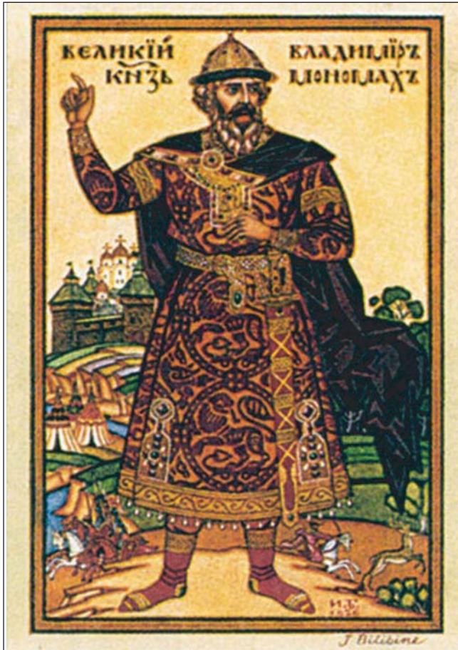
Великий князь Володимир Мономах. Картина І.Я. Білібіна. 1926 р.

чаток залізної доби й є аналогічною до культури і складу південних держав мікенців, гетитів, митаній, егейців і, може, етрусків. Це культура, що зв'язує органічно Україну з південною Європою і почасти зі західною, з її прадавнім мистецтвом, моральними, правовими та релігійними здобутками". Наше плазування перед західноєвропейською культурою спровоковано лише одним — незнанням власної історії, нашої культурної спадщини.