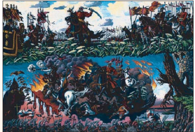
Ілюстрації до повісті М.В. Гоголя “Тарас Бульба”. Проект Алваса Мухіна (О. В. Мухін) ( http://www.proza.ru/avtor/alexord&book=7#7 )

ва. Буде їх слава поміж земляками, поміж літописцями, поміж усіма розумними головами”. Останні слова говорять чимало: справжня слава живе між розумними головами, а не серед люмпенізованих мас, яких підштовхує ненависть, а вона не веде до добра. Ненависть до ворога, перенесена на рідне довкілля, часто-густо використовується тим же ворогом у боротьбі проти нас. Щоб обезсилити українців, нас ділили на “східняків” і “западенців”, “патріотів” і “бандерівців”, доводячи велику націю до самогубства.