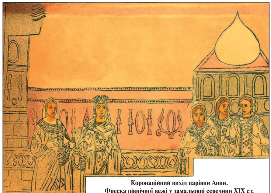
Коронаційний вихід царівни Анни. Фреска північної вежі у замальовці середини XIX ст.

Джерела кінця XVI - XVIII ст. свідчать, що традиція пов'язувати заснування Софії з часами Володимира по-