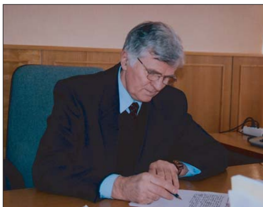
Петро Толочко доктор істор. наук, академік НАН України, директор Інституту археології НАН України, м. Київ

П ро час будівництва в Києві “міста” Ярослава історики сперечаються, починаючи з першої чверті XIX ст. (детальніше див., зокрема [1]). Причиною цього є суперечливість літописних свідчень. У “Повісті минулих літ” розповідь про закладення “города великого” з Золотими воротами, Софійським собором, церквою Благовіщення, а також монастирями св. Георгія і св. Ірини вмішена за 1037 р. ([2], с. 102). У Новгородському першому літописі, як і в низці пізніших літописних списків, про це будівництво повідомлено у статтях за 1017 і 1037 рр. ([3], с. 180).