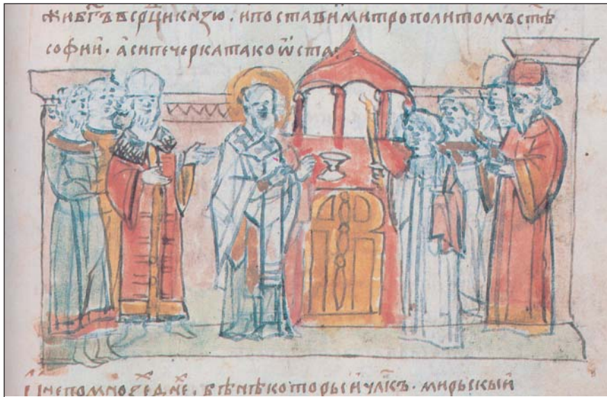
Поставлення Іларіона митрополитом у Софії Київській. Мініатюра Радзівілівського літопису. XV ст.

Не все так однозначно й зі свідченнями “Слова про закон і благодать” митрополита Іларіона. У ньому міститься знаменита фраза, яка проводить історичну паралель між Володимиром і Ярославом та єрусалимськими царями Давидом і Соломоном: “Иже недокончаная твоя наконьча, акы Соломонъ Давыдова, иже дом Божій великий святыйн его премудрости съезда на святость и освященіе граду твоєму” ([7], с. 168).