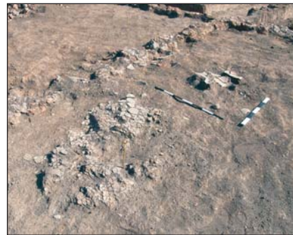
Цим відбиткам дерев'яного перекриття трипільського житла (зліва) близько 6 тис. років. Під завалами обпаленої обмазки (справа) археологи знаходять посуд, рештки інтер'єру приміщень та інші речі, залишені колись трипільцями. Розкопки на поселенні Небелівка, спільний британсько-український дослідницький проект, 2009 р.