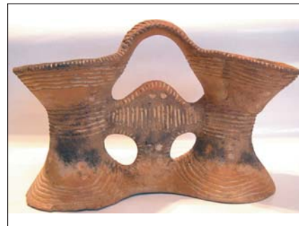
Два "біноклі" та грушеподібна посудина (зліва) — знахідка на трипільському селищі в ур. Коломійців Яр біля с. Копачів (Київщина) підтвердила: сто років тому В. В. Хвойка , справді, відкрив подібні групи посуду, вивчаючи трипільські селища в околицях містечка Трипілля. Розкопки М.Ю. Відейка , 2006 рік.