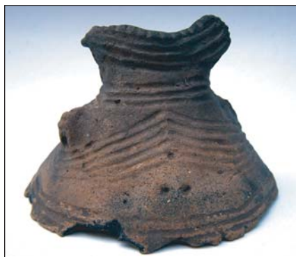
Біноклеподібна посудина (справа) (друга пол. V тис. до н.е.), знайдена в ур. Коломійців Яр, що перебуває нині в експозиції Київського обласного археологічного музею