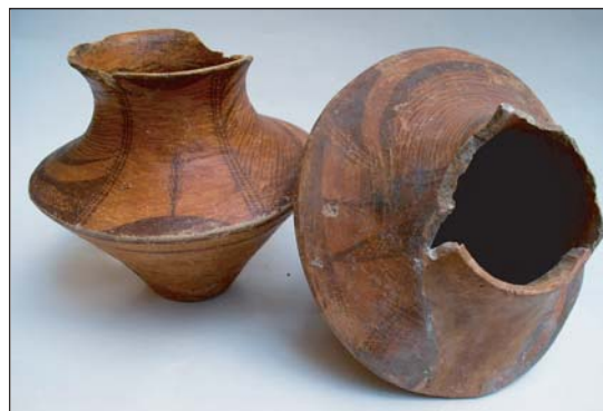
Покришка із ручкою (зліва) у вигляді стилізованого зображення птаха (трипільська культура, друга пол. V тис. до н.е.) з розкопок в ур. Коломійців Яр.