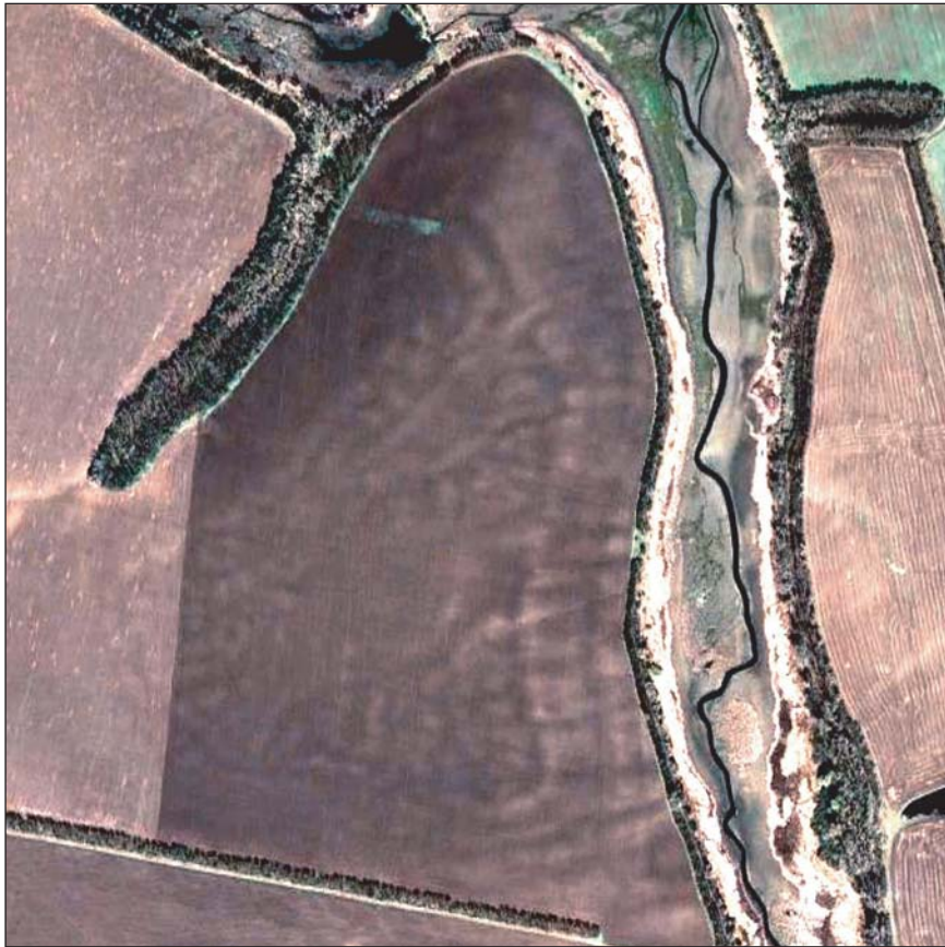
Нині кожний бажачий, навіть не виходячи з власної квартири, може побачити, як виглядають сліди поселень трипільської культури, — варто лише зайти в Інтернет і уважно переглянути супутникові знімки, зокрема: сліди поселення площею близько 300 га (поч. IV тис. до н.е.) можна побачити на полях біля с. Небелівка на Кіровоградщині (зліва); трипільське селище площею близько 70 га біля с. Ятранівка в Черкаській області

понад чотири з половиною тисячоліття. Невблаганний час стер з поверхні сліди трипільської культури, яка не залишила після себе ні пірамід, ні зіккуратів. Забуті давні назви й імена. Давня епоха, точніше, її відгомін та тіні, повернута до буття лише завдяки археологічним дослідженням, які розпочалися наприкінці XIX ст.