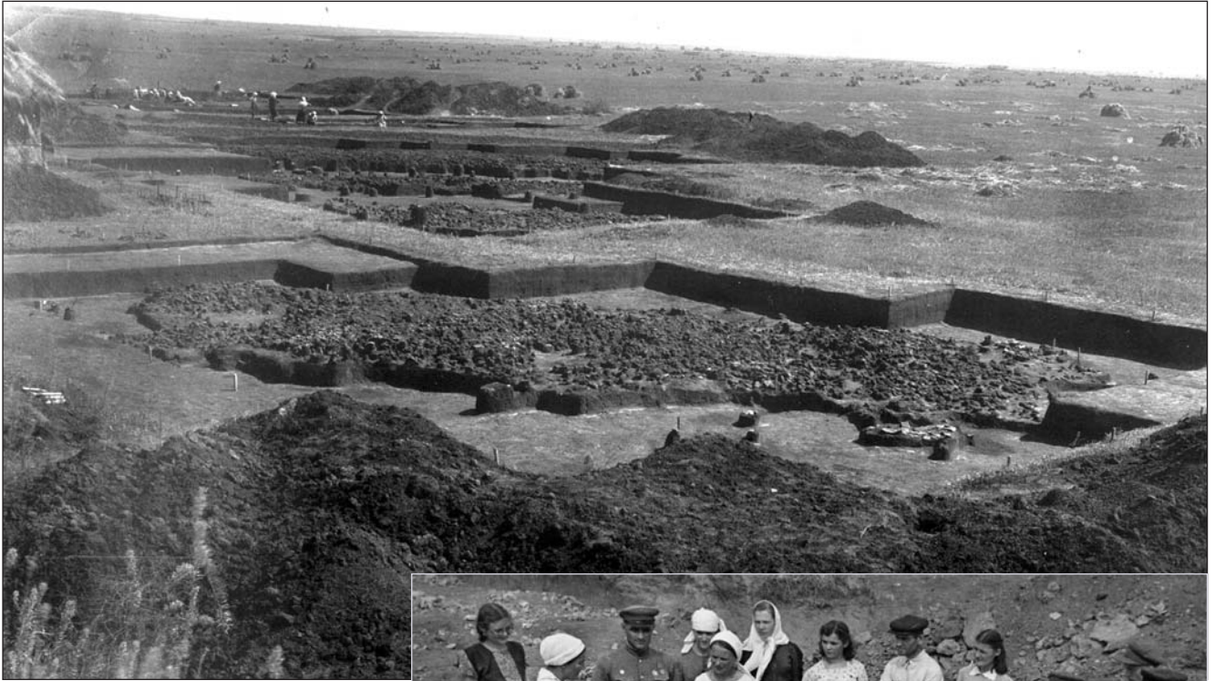
Наймасштабніший дослідницький проект 1930-х років із вивчення трипільської культури: розкопки поселення в урочищі Коломійщина-I біля с. Халеп'я на Київщині. На фото можна побачити одразу кілька відкритих трипільських "площадок".

Мить історії: відома дослідниця трипільської культури Т.С. Пасек проводить екскурсію на розкопці біля с. Володимирівка, 1947 рік.