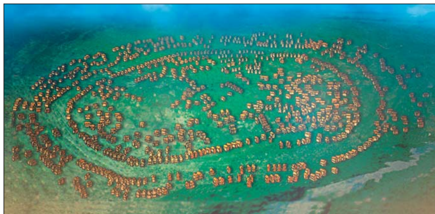
Таблиця, на якій зображено перші знахідки кераміки трипільської культури, зроблені 1895 року у с. Верем'я В.В. Хвойкою.

Так могло виглядати поселення-протомісто біля с. Майданецького на Черкащині, близько сер. IV тис. до н.е. Реконструкція за даними магнітної зйомки та археологічних досліджень. Малюнок М. Ю. Бабенко