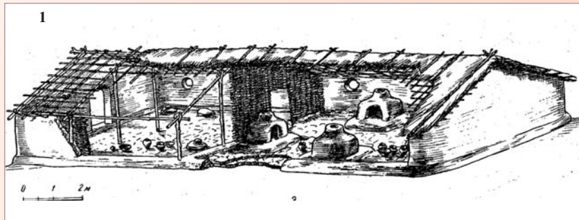
Рис. 1. Коломійщина I. Реконструкція житла №2 за Т. Пассек Рис. 2. Ріпниця I. Реконструкція житла №2 С.М. Рижова і В.О. Шумової Рис. 3. Гребені. Фрагмент посудини, антропоморфне зображення Рис. 4. Ржищів. Фрагмент посудини, антропоморфне зображення Рис. 5. Ріпниця I. Графічний малюнок посудини Рис. 6. Біноклеподібна посудина з колекції В. Хвойки. Національний музей України

гатошарової пам'ятки поблизу с. Козаровичі, що за 50 км на північ від Києва ( В. Круц , 1966-1968, 1979-1972 рр.), дозволили виділити в Київському Подніпров'ї ще одну хронологічну групу пізньотрипільських пам'яток — чапаївську, що була проміжною ланкою між пам'ятками типу Коломійщина I і Лукашівськими. Отже цілеспрямовані розвідки і розкопки цих археологів дозволили простежити безперервність розвитку трипільської культури в Подніпров'ї, що характеризується такими основними пам'ятками як Коломійщина II — Коломійщина I — Чапаївка —