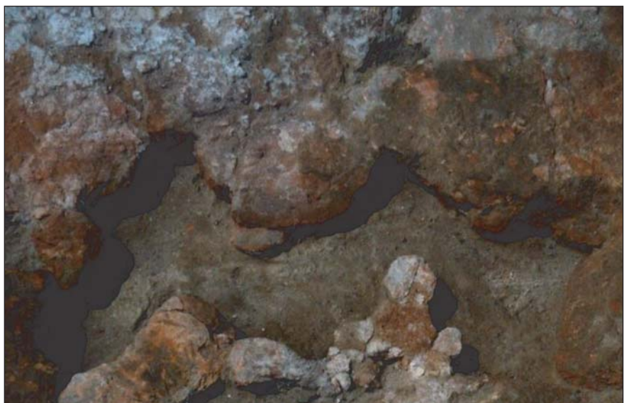
Розкопки в Ріпниці 1, 2004 р.

(згори) Деталь розкопу площадки №4. Рештки вимостки-лежанки, що містилась на другому поверсі житла.