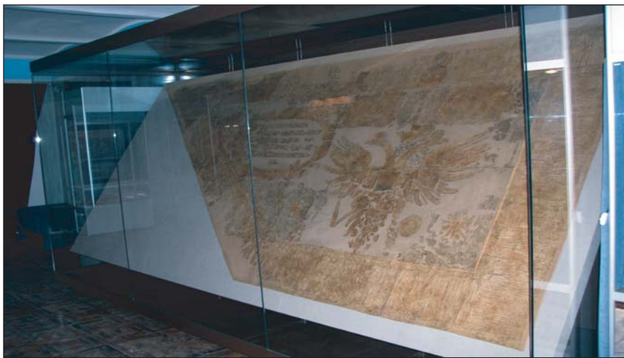
Унікальна національна реліквія України — гетьманський прапор кінця XVII ст. із фондів Харківського історичного музею

Важливим напрямком діяльності з вивчення і популяризації пам'яток історії та культури Слобожанщини є подальше удосконалення виставкової роботи. Щороку музей організовує більше двох десятків різноманітних тематичних виставок. Особливо популярна серед відвідувачів була виставка "Свіча скорботи", присвячена сумній даті 75-річчя Голодомору 1932-1933 років в Україні. Завдяки вдалому архітектурно-художньому рішення та застосуванню сучасного технічного обладнання, матеріали виставки промовисто та емоційно розповідали про страшну трагедію, якої зазнав український народ у часи лихоліття. Зовсім інший характер мала колекційна виставка кераміки "Перлина Слобожанщини" — виставка будянського фар-