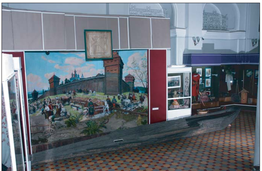
Фрагмент стаціонарної експозиції "Харківщина у ІХ-ХVIII ст."

У 1993 році Харківському історичному музею було надано нове приміщення по вул. Університетській, 5.