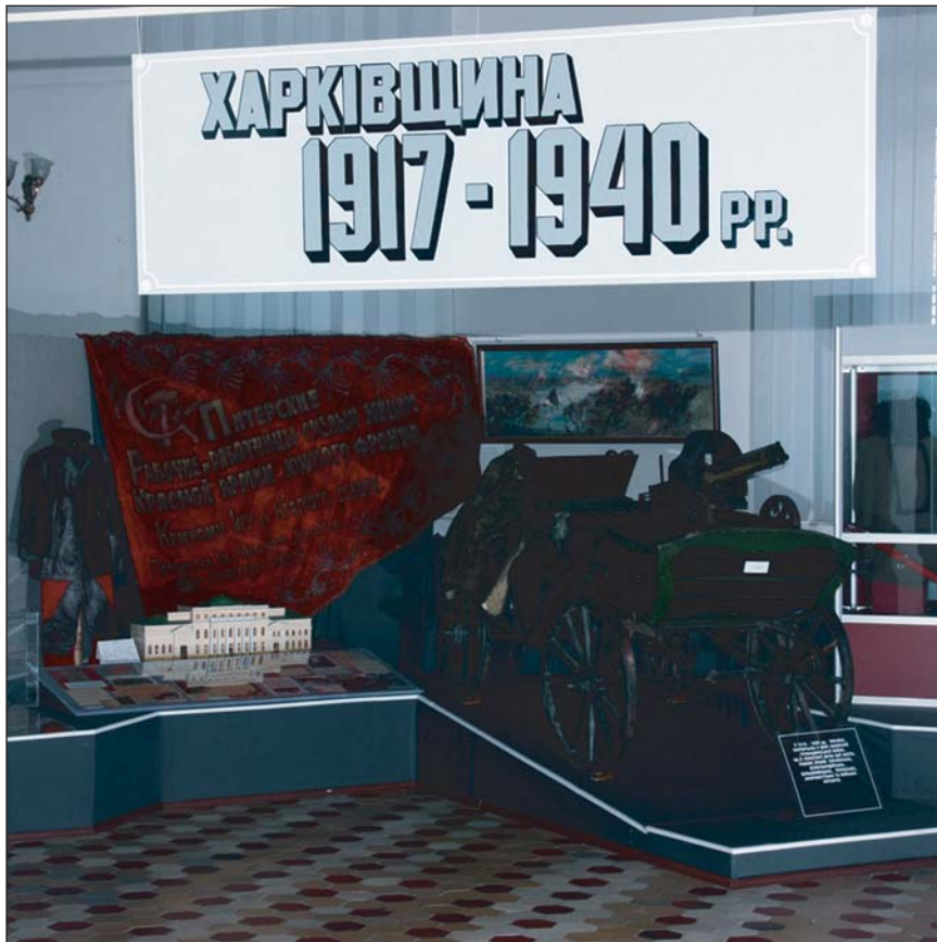
Стационарна виставка "Харківщина 1917-1940рр."

1941-1943 рр. зібрання харківських музеїв зазнали величезних, непоправних втрат. Загальна кількість знищених предметів, що належали історичному, краєзнавчому музеям та Музею Революції, перевищувала 300 тис. одиниць.