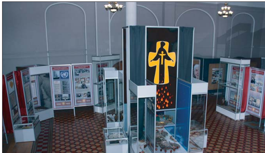
Фрагмент стаціонарної експозиції "Свіча скорботи", присвяченої 75-річчю Голодомору в Україні 1932-1933 рр.

Колектив Харківського історичного музею підтримує міжнародні зв'язки у виставковій роботі. У жовтні 2009 року Фондом "Україна 3000" і Крайовим об'єднанням Райнланд (Німеччина) в приміщенні Харківського історичного музею була представлена міжнародна виставка "Трищина через усе життя", що базується на спогадах примусових робітниць в землі Райнланд. Співробітники музею доповнили виставку документами, фотографіями, оригінальними речами з фондів музею, які документально доповнювали спогади робітниць та промовисто розповідали про всі етапи вербування українських робітниць на роботи до Німеччини. Сухі віти з багряними гронами калини, червоними яблуками та польовими квітами досить