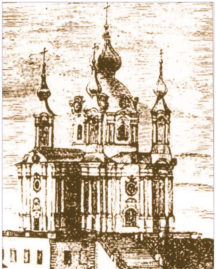
Київ. Церква Св. апостола Андрія Первозванного (гравюра середини XIX ст.)