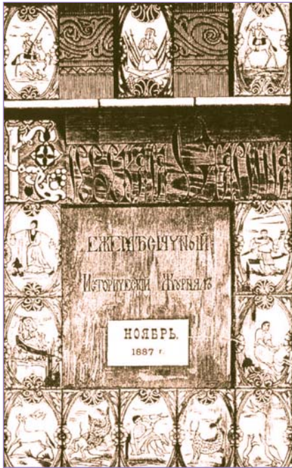
Одна з обкладинок журналу "Київська Старовина" (листопад 1887 р.)

світ. Журнал мав величезний успіх, і не тільки у селах, а й у містах. Його читали не лише духовні особи, але й багато світських — від селян до вищих сановників і навіть представників імператорської родини. Вже в перший рік існування "Керівництво для сільських пастирів" мало величезну передплату, а окремі матеріали різних його чисел частенько переписували від руки й у такому вигляді розповсюджували по всій Російській імперії.