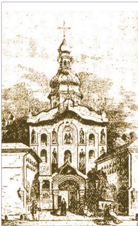
Києво-Печерська Лавра. Троїцька надбрамна церква (гравюра серед. XIX ст.)