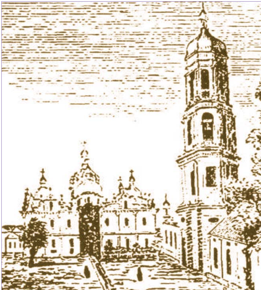
Києво-Печерська Лавра (гравюра середини XIX ст.)