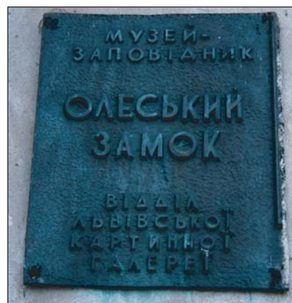
Олеський замок — видатна пам'ятка архітектури й історії XIII-XVIII ст.

З 1944 р. — місто знову у складі Радянської України, а з 1991 р. — у складі незалежної української держави.