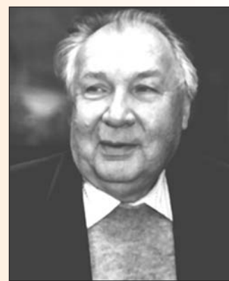
Вадим Олександрович Топачевський

водного господарства АН УРСР, який очолював Є.В. Опіков . Наступного року переходить до аспірантури при кафедрі морфології й систематики спорових рослин Київського університету, приєднавшись до гурту провідних науковців, які розкрили ширий талант і потенціал майбутнього вченого. Коло дослідницьких інтересів — рослинний світ водойм, флора водоростей. Пройде небагато часу, і школа альгологів Топачевського стане провідною в Україні, збагатить вітчизняну науку талановитими вченими. Формування цієї школи було нерозривно пов'язане з науково-педагогічною діяльністю в Київському університеті, де він викладав курси нижчих рослин, цитології, філогенії рослин, альгології та гідробіології, завідував кафедрою нижчих рослин (від 1938), обіймав посаду декана біологічного факультету (1956-1959). Водночас у 1945-1951 рр. завідував новоствореною лабораторією альгології Інституту ботаніки АН УРСР.