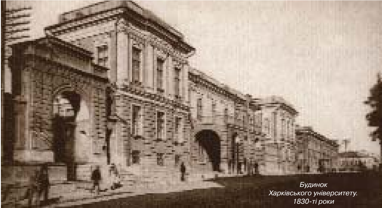
Будинок Харківського університету. 1830-ті роки