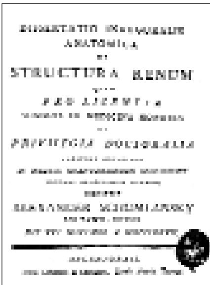
Титульний лист першого видання дисертації О.М. Шумлянського "Про будову нирок" (1782)

способом позбавитись цього. Що Ви про це скажете?” — звертався О. Шумлянський до свого московського приятеля.