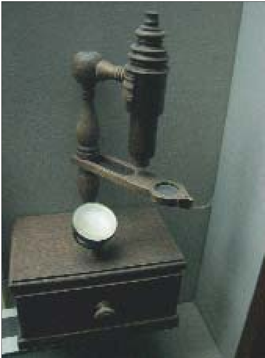
Мікроскоп XVIII ст. (Національний музей медицини, м. Київ)

лянського була знову перевидана у вигляді окремого трактату і стала широківідомою та визнаною в Європі [1] (в період 1783-1803 рр. вийшло 18 схвальних рецензій на цю роботу; згадували про неї і в XIX ст.).