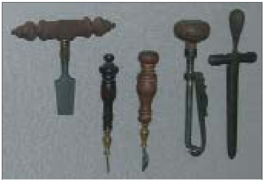
Медичні інструменти XVIII ст. (Національний музей медицини, м. Київ)

Ці відкриття О.М.Шумлянського були настільки добре обґрунтовані, що вчені відразу визнали їх як очевидні. Видатний анатом того часу І. Маєр (I. Mayer) у своїй восьмитомній праці, що вийшла у Берліні, декілька разів посилається на працю нашого земляка про будову нирок. Він підкреслював, що Шумлянський найточніше, порівняно з іншими дослідниками, описав будову нирок. Крім того І. Маєр використовував у своєму анатомічному атласі гравюри з дисертації Шумлянського. Приятель О.М.Шумлянського, славетний російський інфекціоніст і наш земляк Данило Самойлович у своєму листі до Діжонської академії, опублікованому в Парижі за рік після виходу у світ дисертації, писав про неї: “Дисертація Шумлянського про будову нирок з таблицями його власної роботи принесла йому велику славу”. В 1788 р. докторська дисертація Шум-