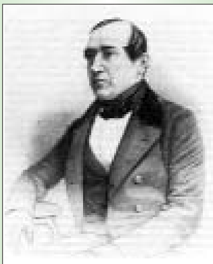
Осип Максимович Бодянський (1808-1877)

Розумом людина спрямовується у світ, а серцем тяжіє до рідного. Саме в серці закоріненний український людський патріотизм — любов до рідної землі та до своїх земляків, а також зорієнтованість на духовні цінності хліборобської культури й на силу рідної землі, що є спасенною суттю антеїзму. Головним у кордоцентризмі — філософії серця — є вибір моральних орієнтирів. Г. Сковорода уособив глибинні моральні цінності українського світогляду, закоріненого в благородстві соборної праці хліборобської культури, й наперед на віки визначив розвиток української духовності й державності. Звідси сквородинський духовний тип української людини — морально зрілого, послідовного творця духовних цінностей. Згідно з вченням Г. Сковороди, перспективу життя народу визначає самоусвідомлення ним своєї священної духовної єдності, а просвітлений дух пробудженої нації — передумова державного відродження України.