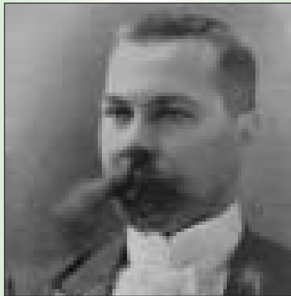
Микола Іванович Міхновський