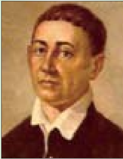
Григорій Савович Сковорода (1722-1794)

Від Варви недалеко до колишнього сотенного міста Чорнухи , де в козацькій сім'ї народився і виріс Григорій Савович Сковорода (1722-1794) — наш великий духовний подвижник, філософ-практик і вчитель народу. Філософію мислитель розумів як мудрість жити в істині й сам жив згідно зі своїм вченням. У філософії мудрого серця Григорія Сковороди виявилася життєва суть питомої української філософії кордоцентризму. Згідно з ученням Г. Сковороди про внутрішню людину й про серце як найточнішу людину, серце — основа неповторності й унікальності особистості, а розум виявляє загальне в діяльності людей.