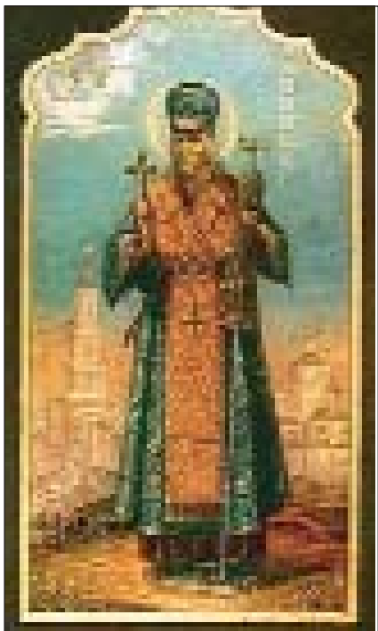
Яким Андрійович Горленко (у чернецтві — святий Йосаф)

ні принципи українського націоналізму як ідеології, яка поєднує цінності особистості й нації, волю індивіда й громади і яка спрямована на утвердження українцями культурної самобутності й здобуття державної незалежності. У програмній праці “Самостійна Україна” виступив фундатором національно-радикальної політично-філософської течії, обґрунтував правові підстави державної незалежності України. М. Міхновський бачив основну причину нещастя своєї нації у зраді інтелігенції інтересів народу та в недостатності серед широкого загалу українців здорового націоналізму, який пробуджує до історичного життя нові народи і є перспективою розвитку людства, бо “ націоналізм — всесвітня сила ”, яка породжує взаємодопомогу й альтруїзм серед поневоленої нації та вивільняє нації від духовного, економічного і політичного рабства.