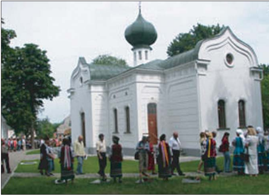
На молитву — до Смиренків. Червень 2008 року. На Черкащині відреставровано родинний храм українських меценатів

на національно-культурні потреби. Вирішальне слово у використанні цих коштів він надав Володимирові Антоновичу. Часто сума добровільних датків Смиренка збільшувалася, оскільки виникала потреба рятувати часописи “Киевская старина”, “Україніше Рундшау” чи “Рутеніше реву”, що мали річні дефіцити бюджетів. Коли ми довідуємося сьогодні про те, що Василь Федорович передав на руки Михайлові Грушевському 100 тисяч карбованців золотом на закупівлю будинку для Наукового Товариства імені Шевченка у Львові, то врахуємо, що Львів належав тоді іншій державі, з якою в царській Росії були стосунки далеко не найкращі.