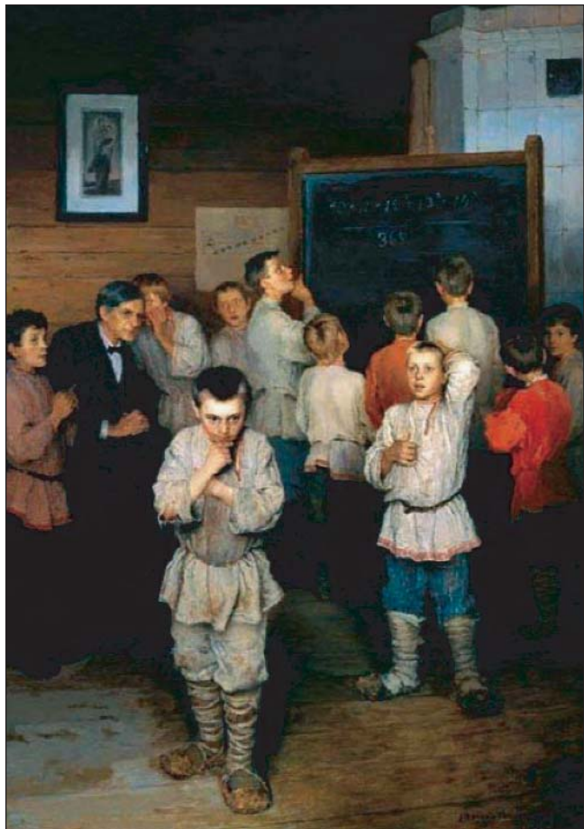
Н.П. Богданов-Бельський. Усна лічба

фірм. Щоб одержати фінансування наукової праці, учений повинен був не обмежитися тільки виявленням і дослідженням нового феномена в природі, але довести нове до промислового виробництва.