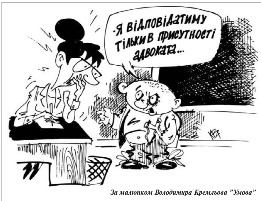
За малюнком Володимира Кремльова "Умова"

Про необхідність поєднання знань освіти і науки в нашій країні говорять і пишуть уже багато десяти років, але дотепер не існує будь-якого регламентованого законами алгоритму їхньої взаємодії, хоча вже кілька академічних інститутів набули статусу одночасної належності до Національ-