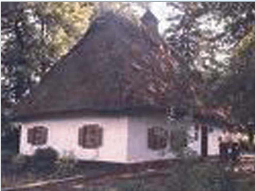
Меморіальний музей Д.К. Заболотного (с. Заболотне Вінницької області)

Іван Скрипаль член-кореспондент НАН України, заступник директора Інституту мікробіології і вірусології ім. Д.К. Заболотного НАН України