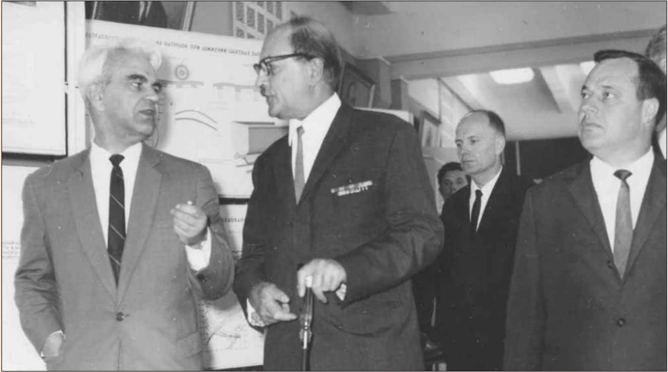
Директор ІГТМ АН УРСР академік АН УРСР М.С. Поляков інформує президентів АН СРСР і АН УРСР академіків М.В. Келдиша і Б.С. Патона про наукову діяльність інституту (травень 1969 р.)

ний період була відмічена урядовими нагородами: медаллю “За відновлення шахт Донбасу” (1946), орденом Трудового Червоного Прапора (1948), орденом Леніна (1949).