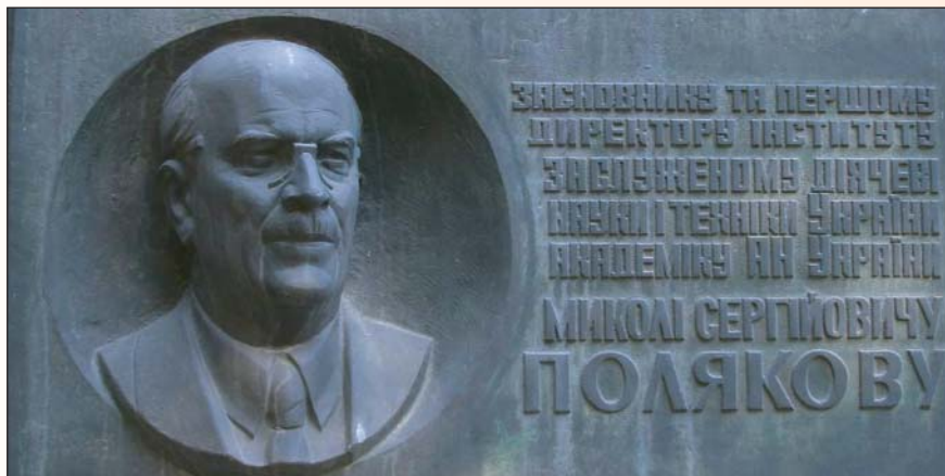
Меморіальна дошка засновнику і першому директору Інституту геотехнічної механіки НАН України академіку НАН України М.С. Полякову на будівлі головного корпусу інституту

Нині інститут продовжує успішно виконувати поставлені перед ним завдання під керівництвом учня Миколи Сергійовича — доктора технічних наук, професора, академіка НАН України, лауреата Державної премії України Анатолія Федоровича Булата.