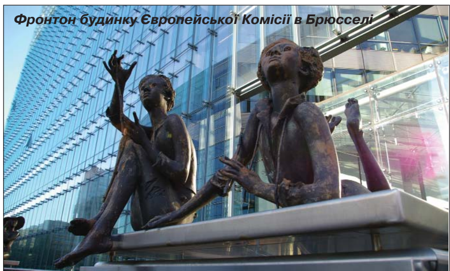
Фронтон будинку Європейської Комісії в Брюсселі

вітчизняні дослідники ведуть відлік глобалізації з різних точок історичного часу. Одні вважають, що глобалізація веде свій початок з розподілу праці, розвитку міст-полісів і міжнародної торгівлі, тобто ще з античних часів. Інші пов'язують глобалізацію з епохою Великих географічних відкриттів та розвитком колоніальної системи. Існує досить обґрунтована система поглядів стосовно того, що сучасний етап глобалізації почався лише в другій половині ХХ ст. і був пов'язаний з науково-технічною революцією, зокрема в галузі інформації та комунікацій. Нарешті, деякі аналітики стверджують, що справжня глобалізація своїм бурхливим розвитком зо-