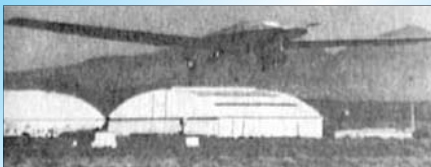
Фотографія 1997 р. ліворуч — фальсифікація, що виявляється при розгляді цієї оригінальної фотографії: з використанням програми Photoshop зображення безпілотного літака розвідки, який літає над ангарами, було перероблено в НЛО

Малознайомі з фактичним матеріалом автори, як правило, стверджують, що НЛО бачать, переважно, пастухи, сторожі, домогосподарки та інші "малозначущі" в науковому плані суспільні елементи. От якби НЛО зареєстрували астрономи, тоді, мовляв, було б про що говорити. Одне із перших офіційно зареєстрованих про-