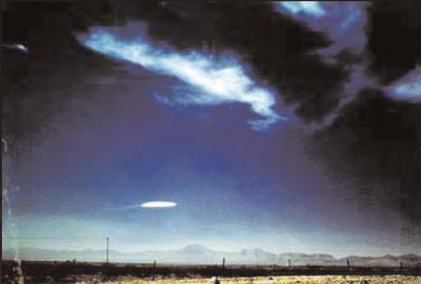
Неправдиві або сфальсифіковані зображення: лентикулярні хмари