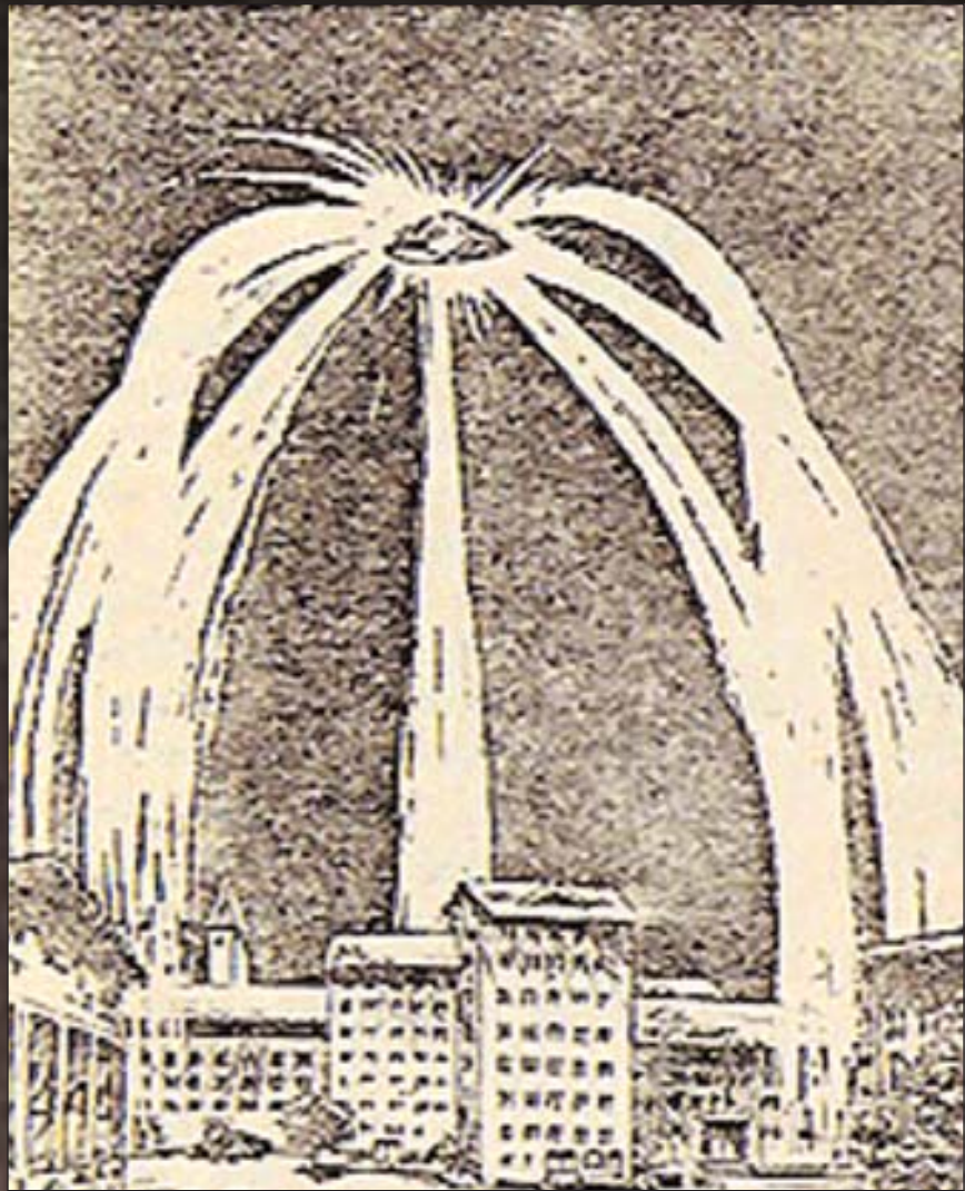
Зображення НЛО, яке з високим ступенем вірогідності є істинним: малюнок очевидця, який зобразив “медузу”, завислу над Петрозаводськом (Карелія) 30 вересня 1977 року

Тему “літаючих тарілок” обговорювали на комунальних кухнях, в інститутських лабораторіях і в кабінетах найвищих державних чиновників. Здавалось би, вивченню цієї проблеми, враховуючи її насправді колосальну значущість для всієї планети, буде віддано найкращі сили, до неї звернулися Академії наук, інші наукові й суспільні інститути. Зокрема, цю проблему обговорювали на Міжнародному симпозіумі в Бюроканській обсерваторії (Вірменія) (див. зокрема “Світогляд”, №3-4 за 2007 р.). За логікою, питання про можливість реального контакту з