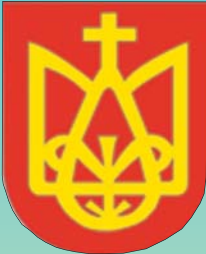
Тризуб Володимира Святого

Нині, як ніколи, є архіважливим перевести Тризуб у духовно-інтелектуальну площину, тобто площину концептуалізації ідеологічних підвалин розбудови держави нації — української України, захисту її культурної ідентичності від інформаційної квазівестернізації, від негативного впливу на національний простір глобалізаційних процесів зодноріднення. Сьогодні опрацювання стратегії української національної ідеї детермінується триєдністю підвалин — Україна: соборна, українська і конкурентна.