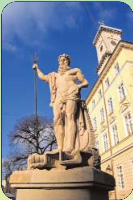
Пам'ятник Нептуну, м. Львів

Нині, як ніколи, є архіважливим перевести Тризуб у духовно-інтелектуальну площину, тобто площину концептуалізації ідеологічних підвалин розбудови держави нації — української України, захисту її культурної ідентичності від інформаційної квазівестернізації, від негативного впливу на національний простір глобалізаційних процесів зодноріднення. Сьогодні опрацювання стратегії української національної ідеї детермінується триєдністю підвалин — Україна: соборна, українська і конкурентна.