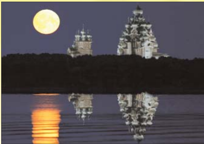
5 листопада 2007 р. за результатами конкурсу найзмістовніших і найгарніших слів у світі, організованого німецьким журналом “Культурний обмін”, серед понад 2,5 тисяч слів, поданих учасниками з 60 країн і регіонів, переможу отримало турецьке слово Yakamoz . Українською мовою його можна перекласти як “віддзеркалення Місяця на поверхні води”

В працях Шеллінга і Гегеля платонівська філософія знайшла класичний варіант завершення. За Гегелем, розвиток є діяльністю світового