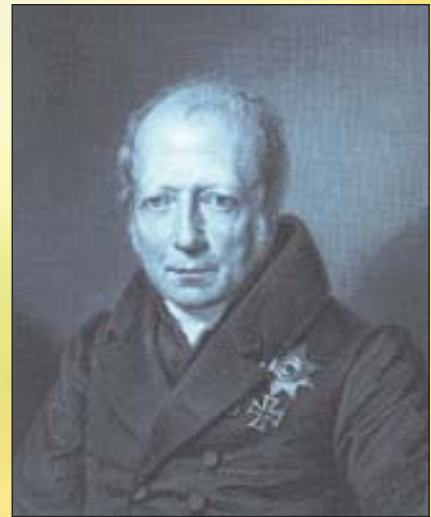
Вільгельм фон Гумбольдт (1767—1835)

Хронологічно першими джерелами, що містять вказівки на особливу роль Слова в житті людини і буття є релігійні, а згодом теософські слова “ Спочатку було Слово... ” (з Євангелія від Іоанна). Традиційна релігійна думка розуміє під Словом не “мовну одиницю”, а дещо більше: ідею, дух, першооснову і першопричину буття