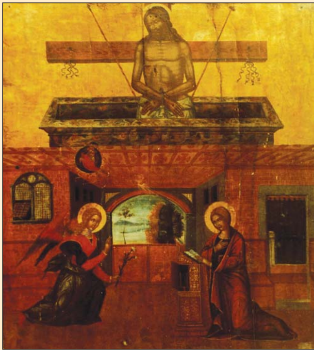
Ікона "Благовіщення". XV ст. Острозький краєзнавчий музей