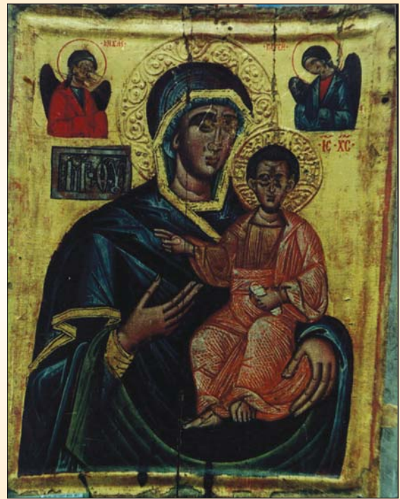
Ікона "Богородиця Одигітрія". XVI ст. Острозький краєзнавчий музей

розька академія не тільки протидіяла полонізаторському впливові на молодь єзуїтських шкіл, а й була першим навчальним закладом Східної Європи, у якій вітчизняна культура поєднувалась із західноєвропейською; вона відкривала нові шляхи в освіті України: в ній вперше на порубіжжі греко-слов'янського культурного ареалу та католицької Європи "візантійський Схід" поєднався із "латинським Заходом".