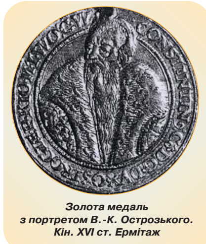
Золота медаль з портретом В.-К. Острозького. Кін. XVI ст. Ермітаж

У 1606 р. В.-К.Острозький вдало використав для боротьби за права Східної церкви рокош Зебжидовського під Сандомиром. Посланець князя архімандрит Києво-Печерський Єлисей Плетенецький домігся, щоб до вимог рокошан було додано ряд пунктів, які стосувались православних. На сеймі 1607 р. у конституції було затверджено право отримувати православні церковні посади тільки прихильникам грецької віри,