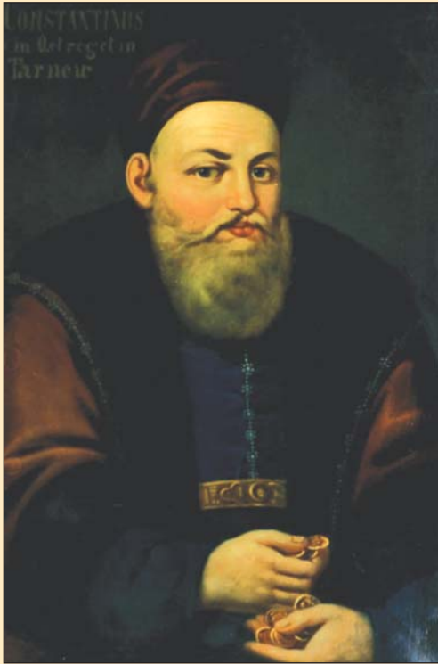
Портрет В.-К. Острозького. Копія XIX ст. Львівський історичний музей