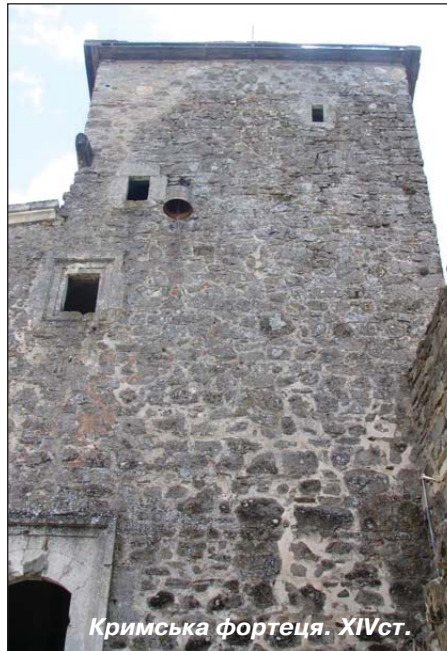
Кримська фортеця. XIVст.

Уже підїжджаючи до Старого Криму, починаєш відчувати, що наближаєшся зовсім до іншого світу, світу з іншим ладом, до якоїсь історичної аномалії. І починаєш бачити те, чого, власне, реально уже, мабуть, і немає. А може, так тільки здається, коли потрапляєш в інакшу стихію, коли твоє пересування світом починають описувати не заяложено обридлі дієслова "їду" чи "їду", а розкішно бадьоре "лечу", і не десь над вишуканою Хацапетівкою в гуркітливому млинку з крилами, названому чомусь літаком, а справді сам, без посередників, над Коктебелем, небо якого густо настояне на азіатській та європейській