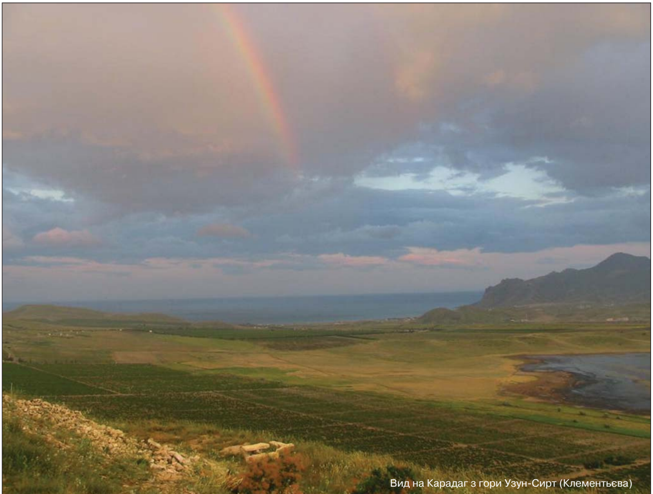
Вид на Карадаг з гори Узун-Сирт (Клементьєва)

Якось я відпочивав у Туреччині, поблизу Анталії, за системою “все враховано”. Тепло, градусів близько 35-40, знову ж таки пальми, світло-сіре море зливається з таким самим небом (Середземне море в перекладі з турецької — біле, через величезні випаровування). Освоєна зовсім недавно пустеля, де ніколи не вирувало життя. Чисто, сучасно, стерильно, причому в усіх значеннях. На третій день почав пити коньяк і вино, на які вдома й задарма уваги не звернув би. Потім зловив себе на тому, що став милуватися сучітками нових росіян у золотих ланцюгах із сонечками в два кіло з німецькими електриками третього розряду, відпочивальниками таких самих номерів, прикрашеними аналогічними ознаками інтелекту. І тихо радів відкриттю, що ми всі — люди, і між нами так багато спільного! І наскільки спрощується життя, коли в ньому уже “все враховано”.