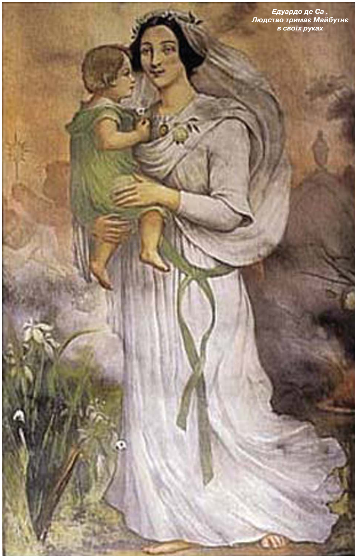
Едуардо де Са . Людство тримає Майбутнє в своїх руках