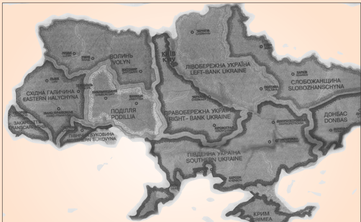
Одна з концепцій нового політико-адміністративного устрою України, в основі якої лежить етнографічна і регіональна самобутність українських земель (газета "Український форум" № 25 — 26 від 29 листопада 2002 р.)

на сході України — Донбас і Слобожанщина, у центрі — Правобережна Україна і Лівобережна Україна, на півдні — Південна Україна і Крим, на заході України — Волинь, Поділля, Північна Буковина, Східна Галичина, Закарпаття.