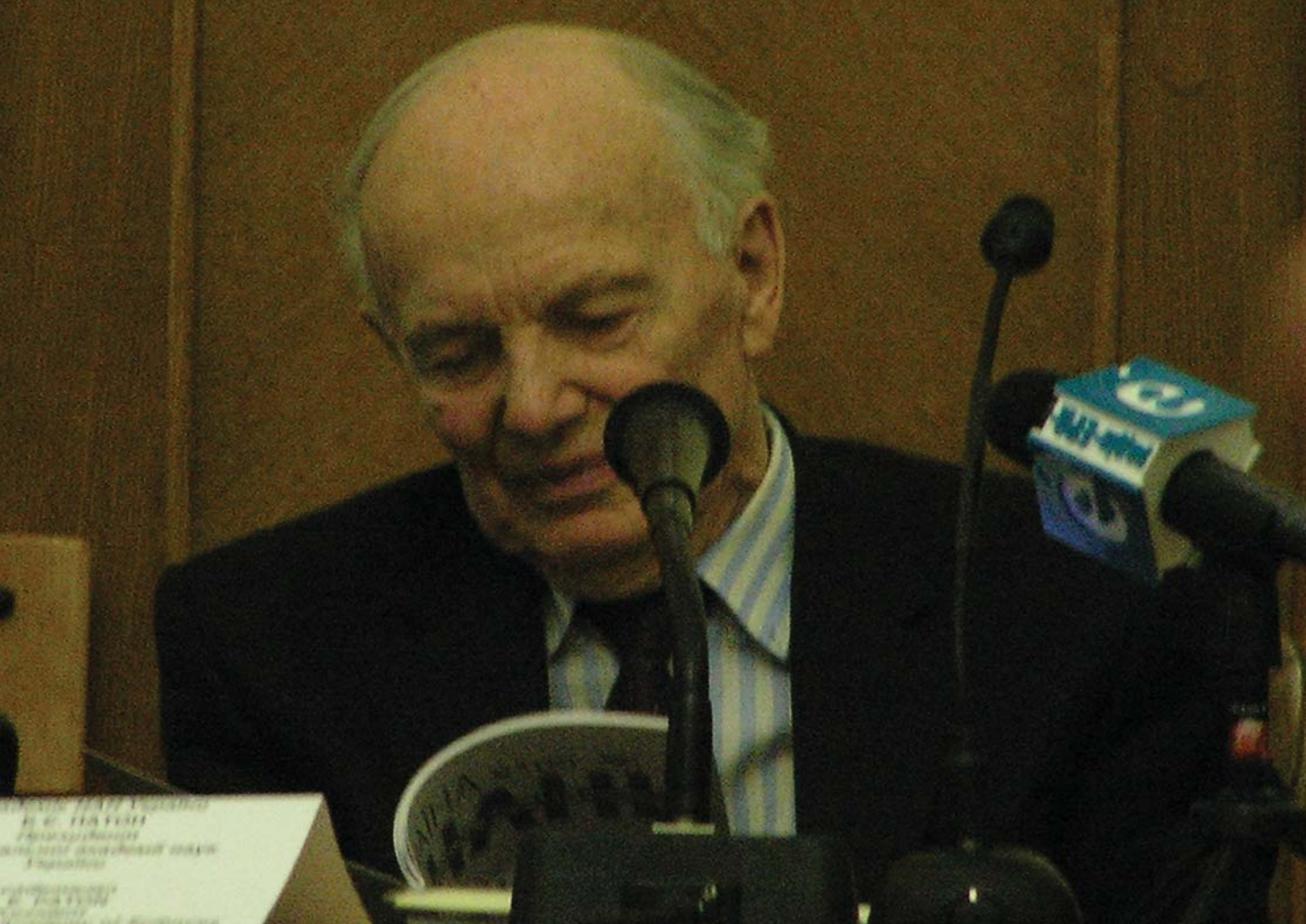
Президент НАН України, академік НАН України Борис Патон. Урочисте відкриття Фестивалю науки. Великий конференц-зал НАН України, 16 травня 2007 р.

демія правових наук України, Українська академія аграрних наук, Академія мистецтв України, Академія педагогічних наук України, Академія медичних наук України, Київський національний університет ім. Тараса Шевченка, а також Представництво Британської Ради в Україні та Український науково-технологічний центр. До речі, сама ідея проведення Фестивалю науки в Україні виникла під час зустрічі президента НАН України, академіка НАН України Б.Є. Патона з представниками Британської Ради в Україні.