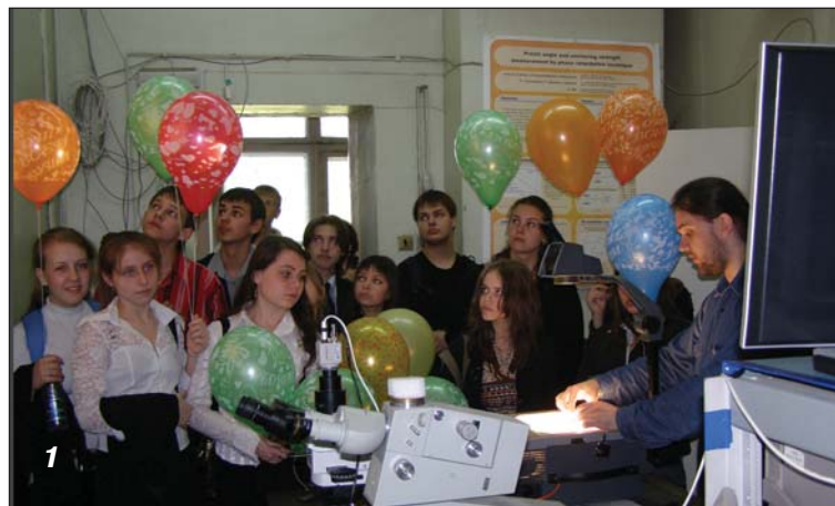
Фестиваль науки. Дні відкритих дверей.

17 травня у приміщенні Великого конференц-залу НАН України відбулась лекція " Електронна наука (E-science) в Україні — шляхи розвитку ". Директор Інституту теоретичної фізики, академік НАН України А. Г. Загородній , директор Інституту програмних систем НАН України, академік НАН України П. І. Андон та заступник директора Інституту кібернетики ім. В.М. Глушкова, член-кореспондент НАН України Ю. Г. Кривонос у популярній формі розповіли присутнім про суперкомп'ютери для інформаційних технологій ( СКІТ ) та мережу суперкомп'ютерів з надшвидкісними каналами зв'язку (проект ГРІД ). Однією з найбільш перспективних галузей науки, що має величезний вплив на процес розвитку нинішньої цивілізації, є інформатика . Людству необхідно нині обробляти гігантські масиви інформації, і рівень розвитку кожної країни значною мірою залежить від потужності обчислювальної техніки і програмного забезпечення, якими вона володіє. Над вирішенням цих проблем багато років працюють вчені цих інститутів і вищих навчальних закладів України. Доповідачі підкреслили, що мережа ГРІД є важливим чинником входження України до європейського і світового науково-освітнього простору. Сьогодні до неї підключені поки що лише найбільші наукові центри України, однак передбачається, що на базі нових суперкомп'ютерних систем буде створений потужний обчислювальний ресурс, який об'єднає користувачів із різних організацій та регіонів.