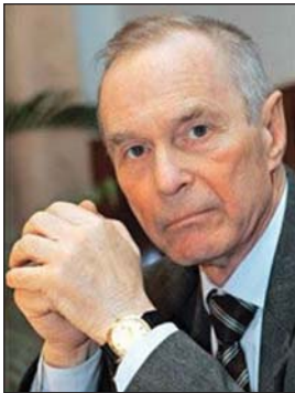
Антон Наумовець доктор фіз.-мат. наук, академік НАН України, віце-президент НАН України