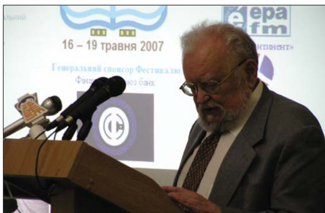
Директор Інституту філософії ім. Г. Сковороди НАН України, академік НАН України М. Попович