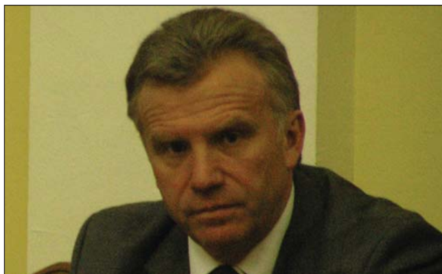
Міністр освіти і науки України С. Ніколаєнко