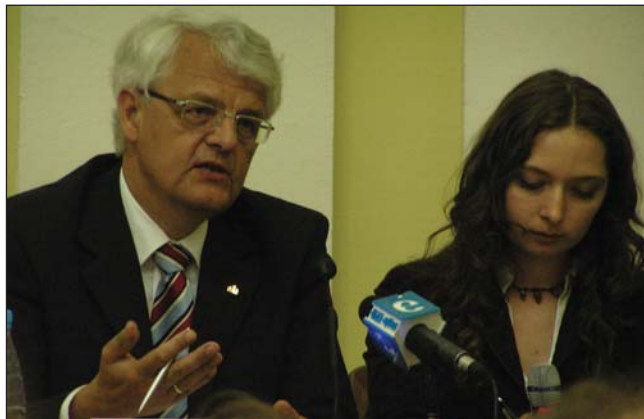
Директор Міжнародного інституту прикладного системного аналізу, професор Л. Хордайк