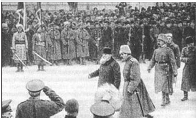
М. Грушевський приймає парад частин Вільного козацтва. Грудень 1917 р.