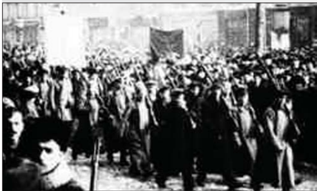
Частини Червоної гвардії в Києві. Листопад 1917 р.