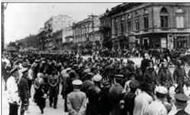
Вступ німецьких військ до Києва. Березень 1918 р.