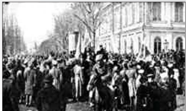
Демонстрація з нагоди проголошення III Універсалу УЦР на Софійській площі в Києві. Листопад 1917 р.