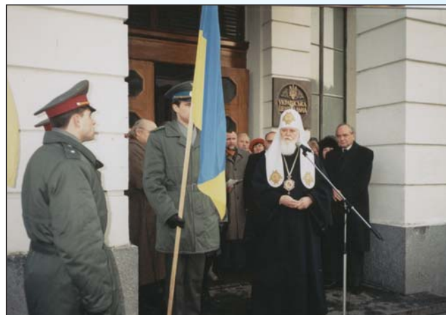
Патріарх Київський і всієї Руси-України Філарет благословляє піднесення Прапора України над Київським Будинком вчителя на честь вшанування діяльності УЦР

їнської інтелігенції (КУНу) організував та провів урочисті збори з нагоди 80-річчя утворення Української Центральної Ради. На зборах виступили академік Ярослав Яцків , голова КУНу Іван Драч та голова "Просвіти" Павло Мовчан , історик Тарас Гунчак та віце-прем'єр-міністр України, академік Іван Курас . По закінченні зборів над Київським Будинком вчителя (Будинком Центральної Ради) було піднесено державний прапор України.