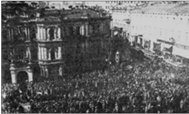
Демонстрація біля Київської Думи. Березень 1917 р.