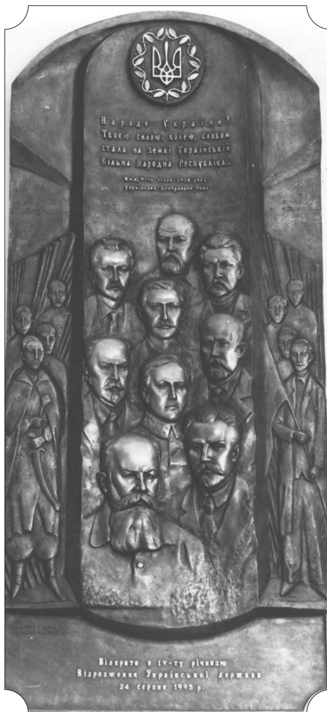
Меморіальний триптих, присвячений діячам Української Народної Республіки. Встановлений у вестибулі Київського Будинку вчителя 24 серпня 1995 р. Скульптор — Руслан Русин

Саме під час її діяльності було закладено основи будівництва майбутнього суспільно-політичного й економічного ладу вільної і незалежної України, що ґрунтувалися на засадах широкої демократії, рівноправності й справедливості. Невипадково нинішній процес державного будівництва багато в чому базується на досвіді державотворчої діяльності Української Центральної Ради.