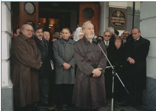
Виступ проф. Тараса Гунчака під час зборів, присвячених 80-річчю УЦР

В урочистому вечорі, присвяченому цій події, взяли участь Президент Української Народної Республіки в екзилі Микола Плав'юк ; Патріарх Київський і всієї Руси-України Філарет ; голова КУНу Слава Стецько , заступник голови Спілки