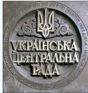
Меморіальна дошка на фасаді Київського Будинку вчителя, встановлена 22 серпня 1995 р.

22 серпня 1995 року. На фасаді Київського Будинку вчителя відкрито меморіальну дошку, яка засвідчує, що саме в цьому будинку по вул. Володимирській, 57 у 1917 — 1918 роках під керівництвом Михайла Грушевського працював перший представницький орган України — Українська Центральна Рада. Дошку було виготовлено на замовлення Київської міської адміністрації і її голови п. Леоніда Косаківського , які підтримали пропозицію Ініціативного комітету такою акцією відзначити четверту річницю незалежності України.