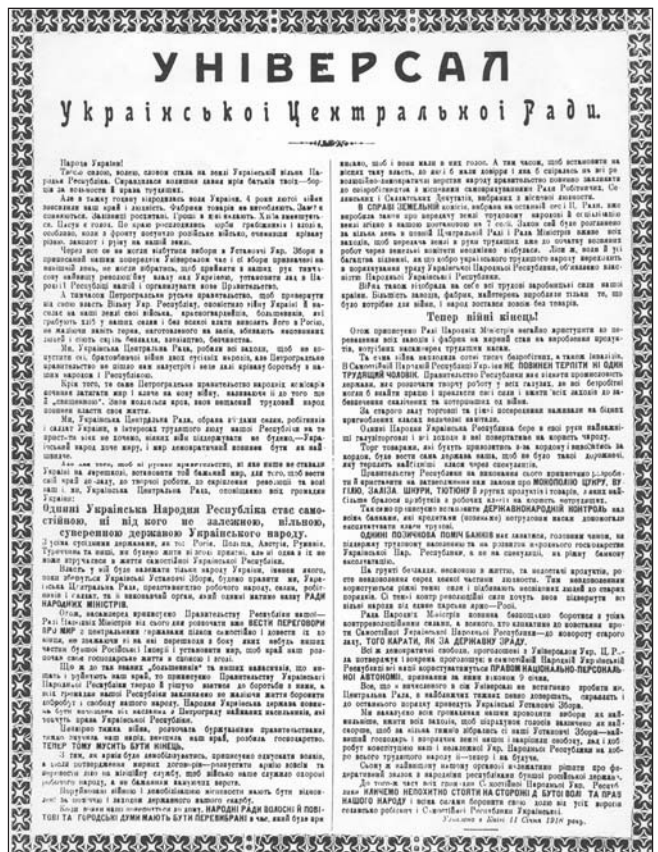
IV Універсал Української Центральної Ради

У цей відповідальний момент 22 січня 1918 року УЦР оприлюднила свій IV Універсал, яким проголосила Українську Народну Республіку самостійною, ні від кого не залежною, вільною, суверенною державою українського народу, а