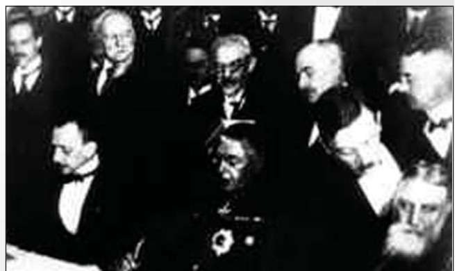
Під час підписання угоди представниками УЦР у Брест-Литовську. 9 лютого 1918 р.