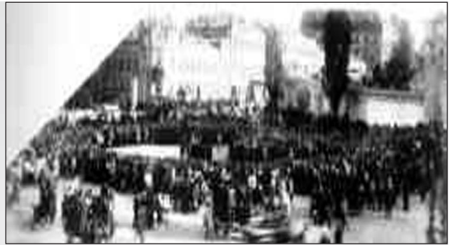
Мітинг на Софійській площі в Києві з нагоди оголошення I Універсалу Української Центральної Ради. 25 червня 1917 р.