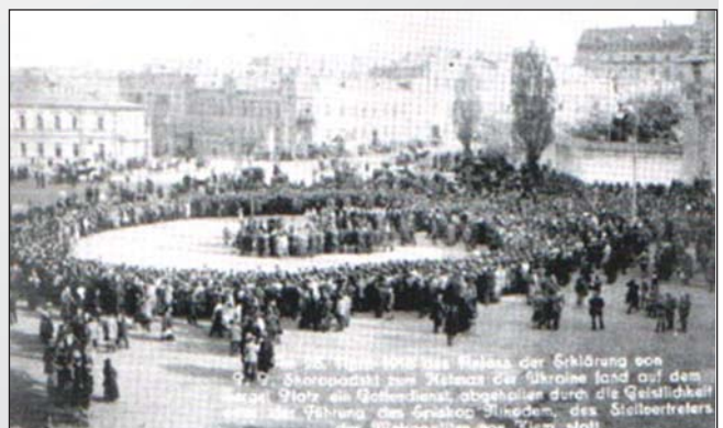
Молебен на Софійській площі в Києві з нагоди обрання П.Скоропадського гетьманом України. 29 квітня 1918 р.