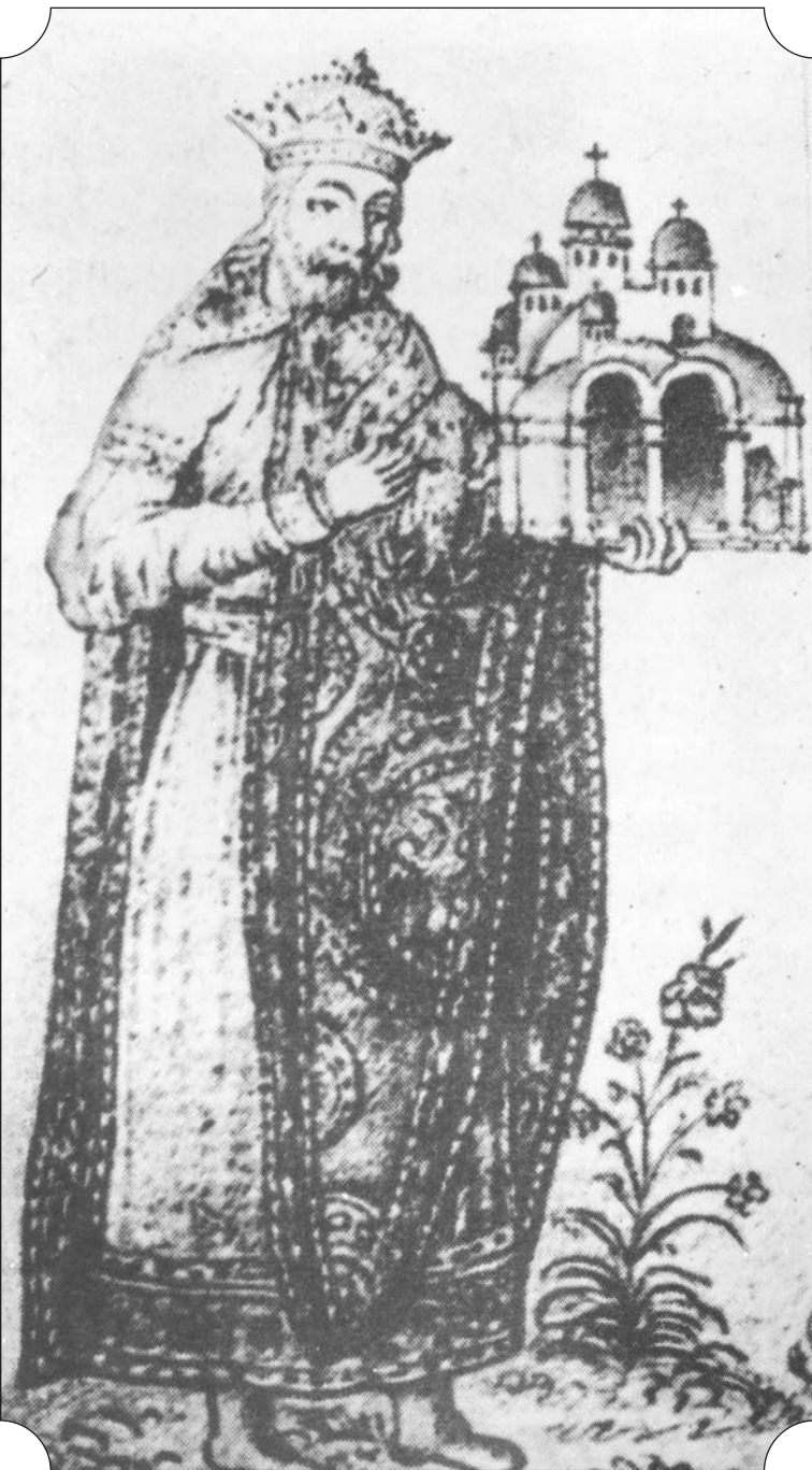
Князь Володимир з макетом Десятинної церкви.

Фрагмент княжого портрета. Фреска у замальовці А. ван Вестерфельда (1651 р.)