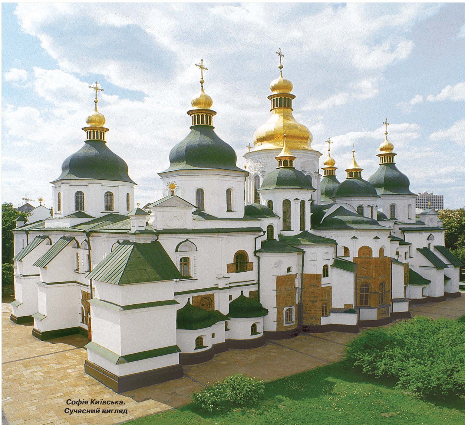
Софія Київська. Сучасний вигляд

У 1497 р. у Софії було покладено мощі вбитого татарами митрополита Макарія , що стали великою святинею Києва (нині знаходяться у Володимирському соборі).