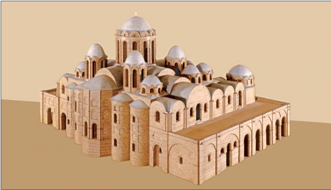
Софія Київська в XI ст. Макет-реконструкція

слав город великий, у него же града суть Златая врата; заложи же и церковь святых Софья, митрополью, и посемь церковь на Золотыхъ вортахъ святых Богородица Благовещение, посемь святого Георгия монастырь и святых Ирины" [2].