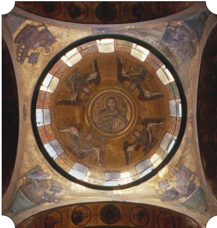
Образ Христа Вседержителя в центральному куполі храму Софії Київської

Притискаючи до серця закрите Євангеліє, Христос десницею двоперсно благословляє, вказуючи вірянам путь до Спасіння. Христос оточений архангелами, які стоять з чотирьох сторін світу, утворюючи почесний ескорт. У мозаїці зберігся архангел у блакитному вбранні, інші три майстерно намальовані М. Врубелем наприкінці XIX ст.