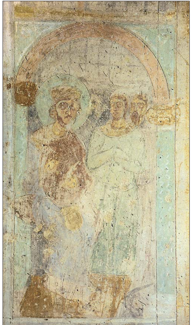
Імператор Василь II — шуряк Володимира в ложі палацу іподрому. Поруч з ним — сановний євнух. В кутку ложі — керівник руського посольства, фактотум Володимира. Фрагмент фрески "Іподром"

Наразі науковцями Національного заповідника продовжується активне дослідження софійських графіті, і вже виявлено чимало цінних записів, які незабаром будуть уведені в науковий обіг.