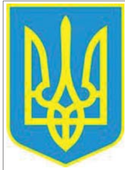
Малий Державний Герб України

Подальший перебіг історичних подій підтвердив слушність такої думки. Саме ці емблеми були обрані для самоідентифікації державами, що постали на українських теренах за доби національно-визвольних змагань початку ХХ ст. Українська Народна Республіка, як уже зазначалося, обрала своїм гербом тризуб. Закон Ради Державних Секретарів про самостійність земель Австро-Угорської монархії від 12 листопада 1918 р., схвалений наступного дня у Львові Українською Національною Радою, передбачав для Західноукраїнської Народної Республіки (ЗУНР) герб у вигляді золотого лева на блакитному полі, а за періоду Української Держави гетьмана Скоропадського Г. Нарбут розробив державну печатку із зображенням козака з мушкетом.