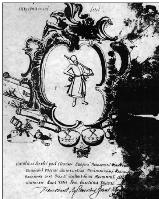
Національний герб із зображенням козака із мушкетом. Середина XVIII ст.

Зокрема, в "Ордері" гетьмана Кирила Розумовського 1755 р. йдеться про обов'язковість